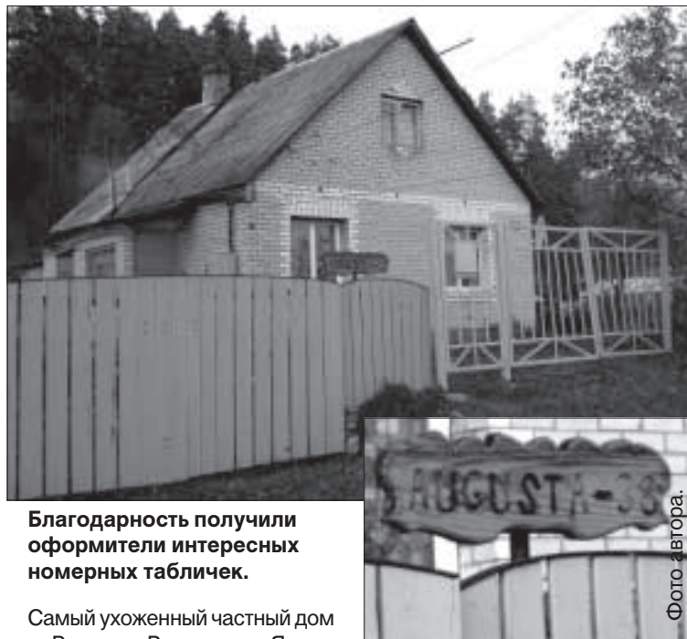
Благодарность получили оформители интересных номерных табличек.

Самыми ухоженными многоквартирными домами признаны здания на ул. Ригас, 110, Райна, 9, Лакстигалу, 2, Райня, 33, Базницас, 2, Спидолас, 3.