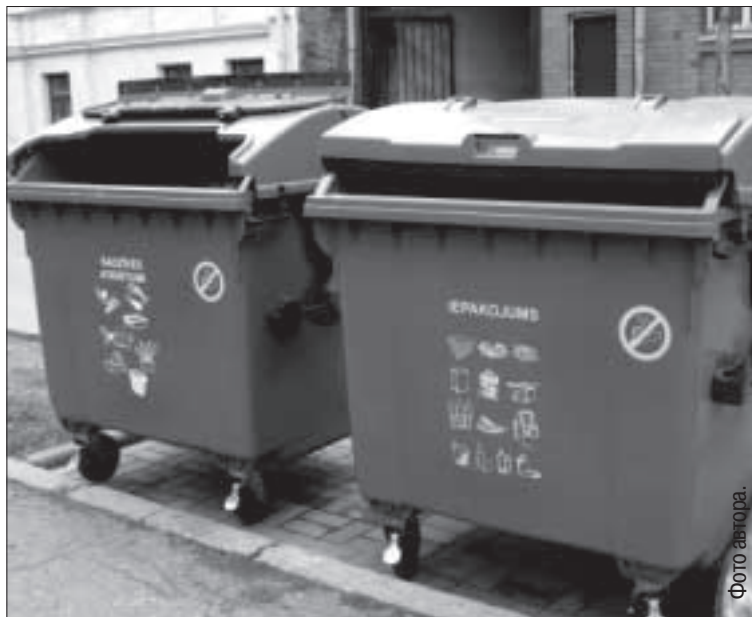
На каждой площадке сейчас стоят по крайней мере два разных контейнера.

В середине декабря «ЭКО Латгале» планирует начать сбор на утилизацию электрических и электронных отходов, в том числе и ненужной бытовой техники, но с одним условием — она не должна быть разобрана. Первое время жителям самим придется доставлять негодные вещи на приемный пункт на ул. Дундуру, 13-а, а позже за агрегатами будут приезжать машины, о чем жители будут оповещены заранее. За вывоз таких отходов не нужно будет платить, а для фирм, которые списывают ненужную электротехнику, данная услуга будет платной.