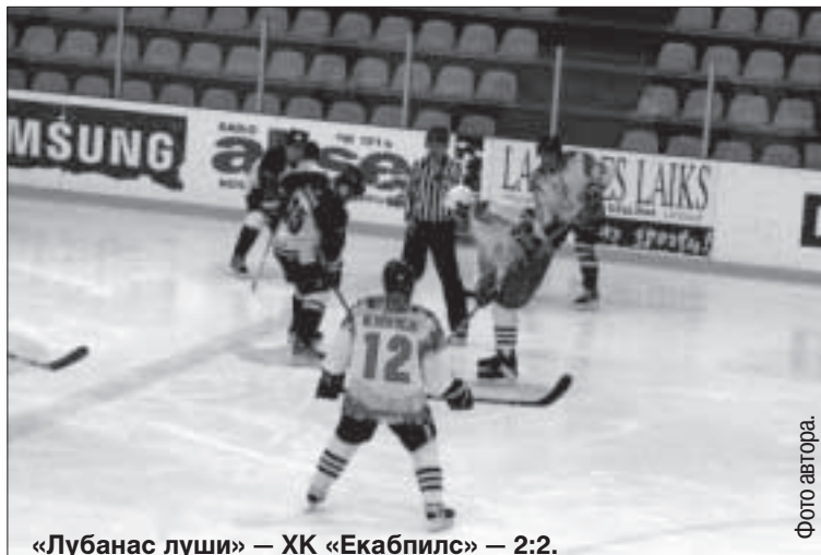
«Лубанас луши» — ХК «Екабпилс» — 2:2.