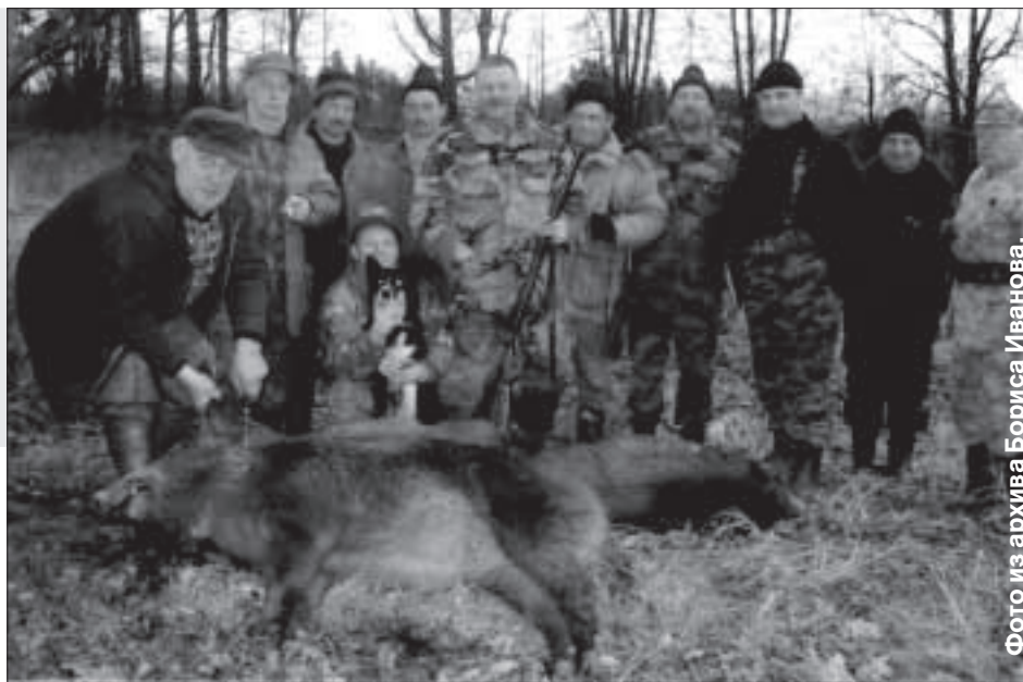
Мушкет с охотниками, добывшими кабанов. А его хозяин — с фотоаппаратом.

След кабана на снегу был отчетливым: долго петлял, но привел к разрытому мурейнику. Загонщики поняли, что это как