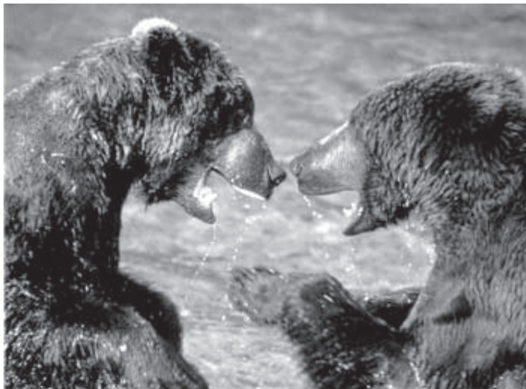
Медвежьи (лат. Ursidae) — семейство млекопитающих отряда хищных. Медведи всеядны, хорошо лазают и плавают, быстро бегают, могут стоять.

Сравнительно с остальными семействами отряда хищных, медведи отличаются наибольшим разнообразием внешнего вида.