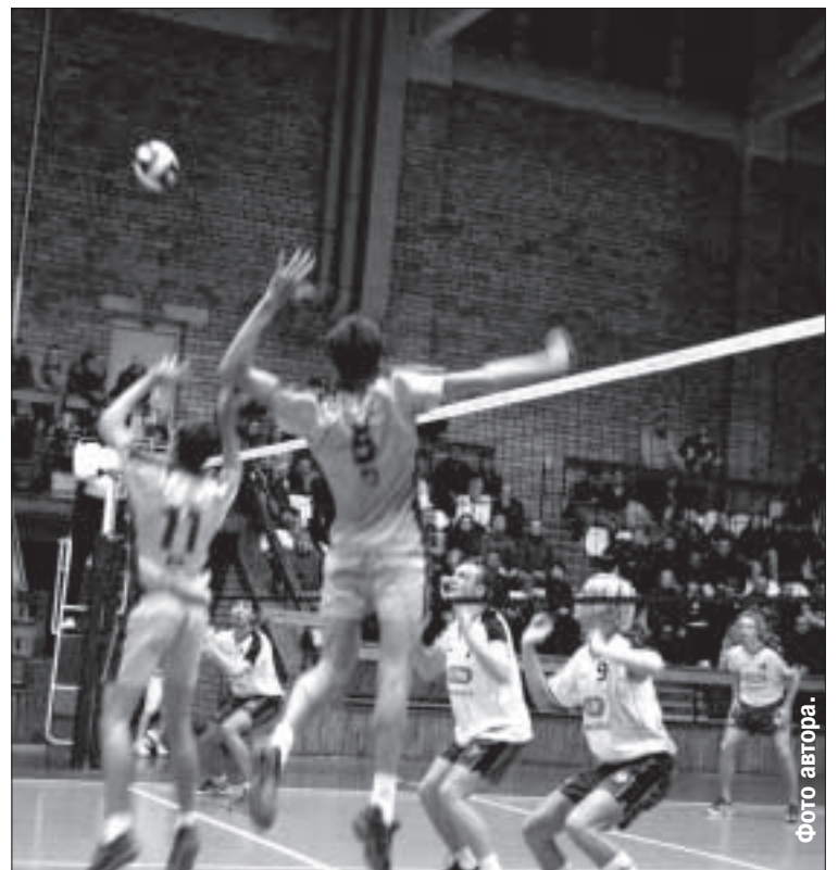
«Эзерземе/ДУ» — «Элви/Кулдига».

Очередные игры Шенкер-лиги, прошедшие в минувшие выходные в Даугавпилсе, к сожалению, закончились для «Эзерземе/ДУ» поражением. В субботу со счетом 2:3 наши ребята уступили команде «Цесу алу», а в воскресенье (1:3) — волейболистам СК «Элви/Кулдига».