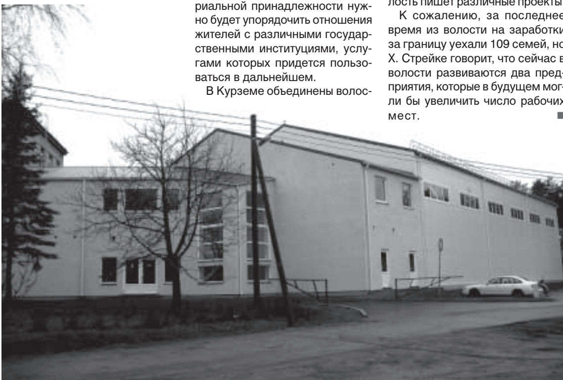
Новый Дворец спорта.

К сожалению, за последнее время из волости на заработки за границу уехали 109 семей, но Х. Стрейке говорит, что сейчас в волости развиваются два предприятия, которые в будущем могли бы увеличить число рабочих мест.