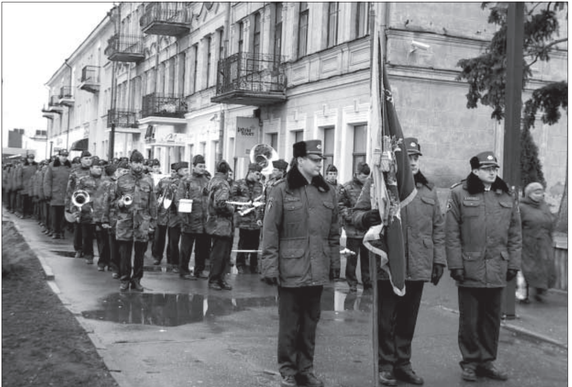
Пограничники готовятся к торжественному маршу.