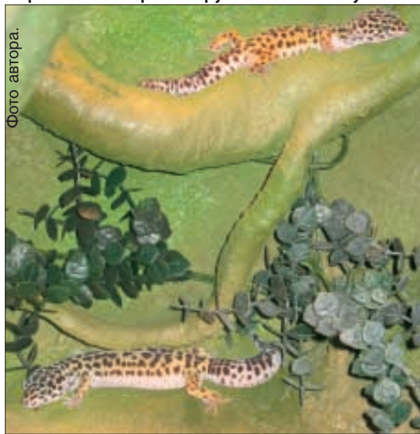
У каждого животного в новых тропиках есть свое местечко.