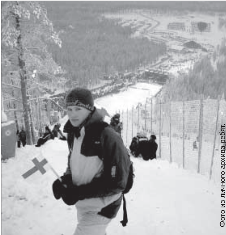
Фото из личного архива ребят.