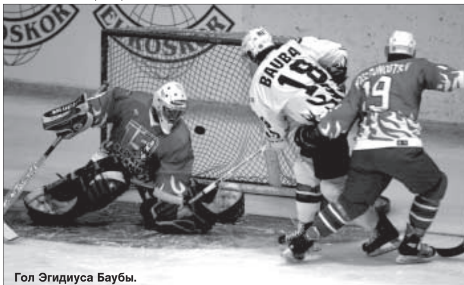
Гол Эгидиуса Баубы.