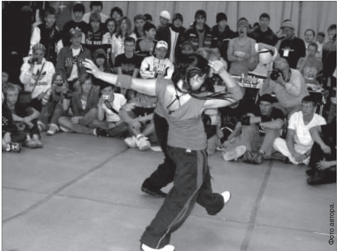
Девушки ни в чём не уступали парням.

В одиночных батлах жюри не принимает решение и не объявляет победителя. В этом случае каждый из зрителей определяет для себя победителя сам. В этом, пожалуй, и заключается главный принцип брейк-данса — демократичность во всём. Соперничество без вражды и злобы — в таком духе проходил фестиваль. Танцоров в кругу назвать соперниками можно условно. В первую очередь это обмен опытом и позитивной энергетикой, возможность общения и знакомства с новыми и интересными людьми.