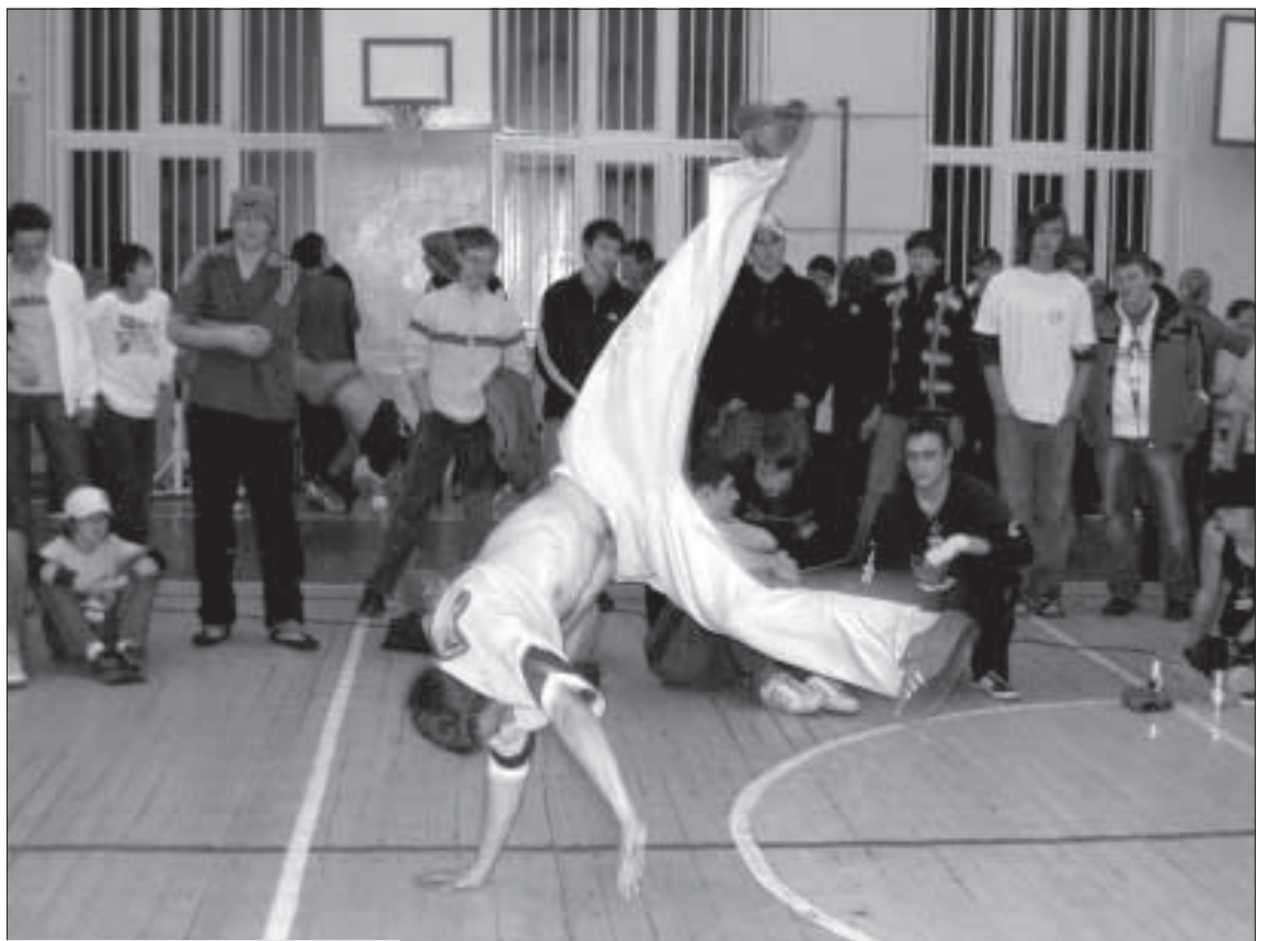
Перед «батлом» требуется разминка.