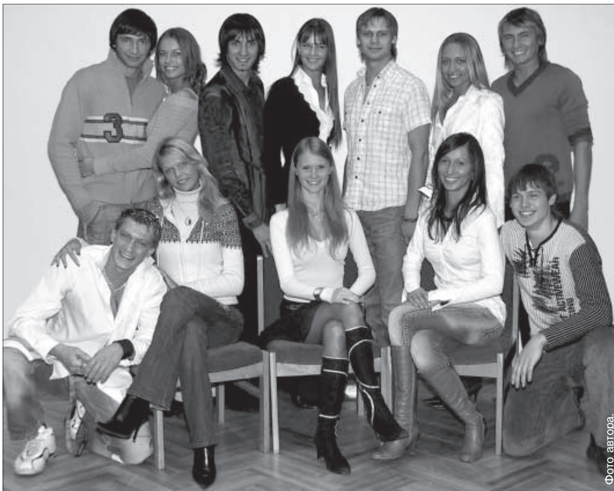
Финалисты конкурса «Мисс и Мистер Даугавпилс 2006».

«Я очень рад, что конкурс «Мисс и Мистер Даугавпилс» признала своим