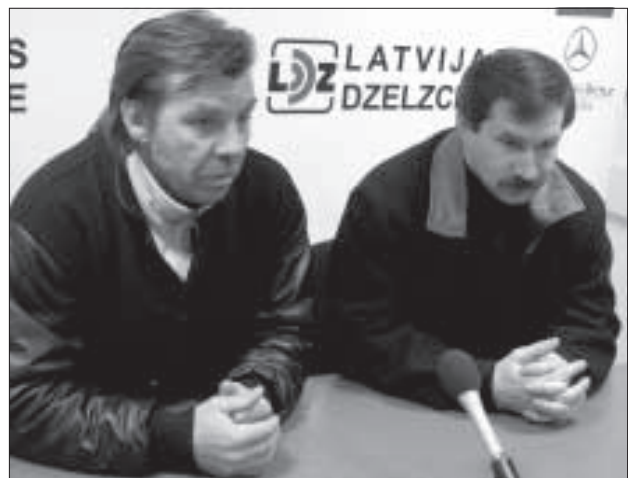
Олег Знарк и Игорь Смирнов.

после матча, на пресс-конференции, главными тренерами команд — Олегом Знарком и Игорем Смирновым.