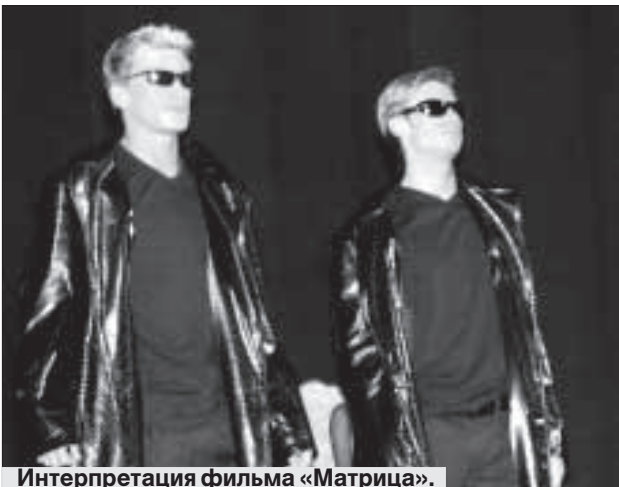
Интерпретация фильма «Матрица».