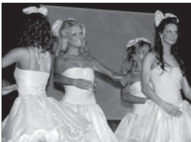
Девушки чувствуют себя в роли кукол.