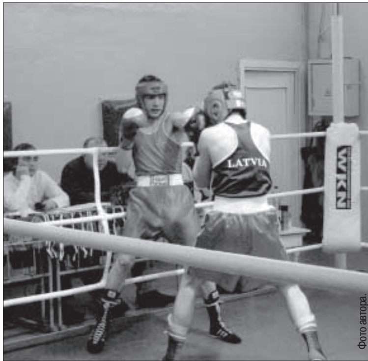
Даже если прижмут к канатам сдаваться не стоит.