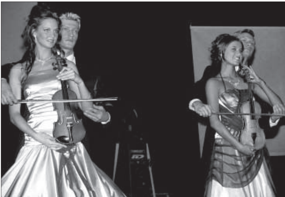
Мотив фильма «Опасные игры».