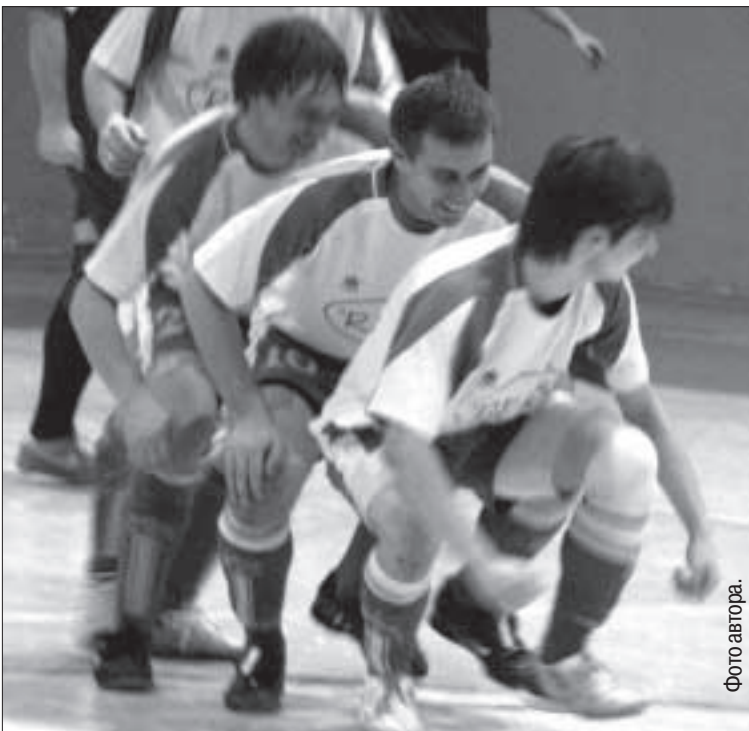
Вот так футболисты «Рейниса» отпраздновали второй гол.