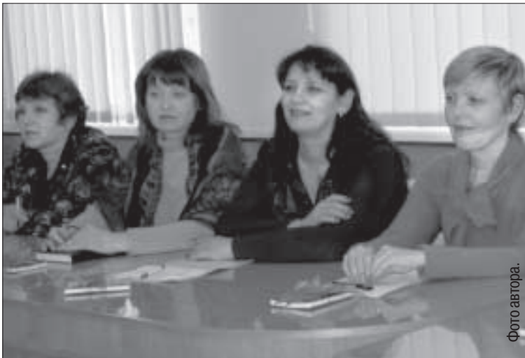
Руководители летних лагерей.

До 15 марта руководители летних лагерей должны подать в Даугавпилсскую думу графики работы, утвердить которые планируется в апреле. В апреле также будет утвержден и размер родительских взносов.