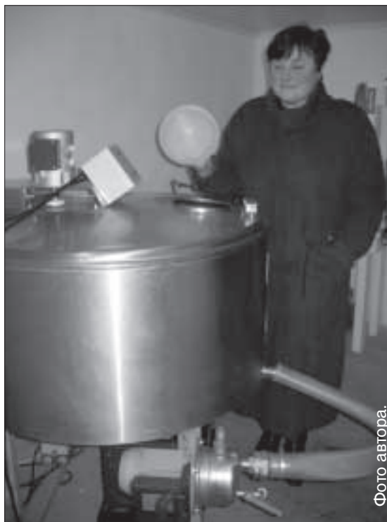
Хозяйка показывает молочную кухню.

Напряжение в электросети в хозяйствах недостаточное, поэтому крестьяне не могут одновременно пользоваться всей необходимой техни-