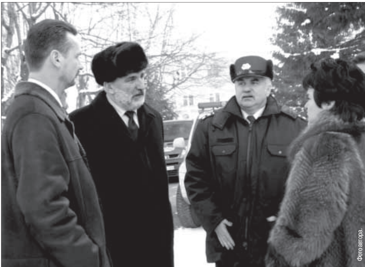
Ивара Годманиса в Даугавпилсской крепости сопровождали председатель Даугавпилсской гордумы Рита Строче, депутат Сейма Виталий Айзбалтс, начальник управления полиции Имант-Янис Бекешс.