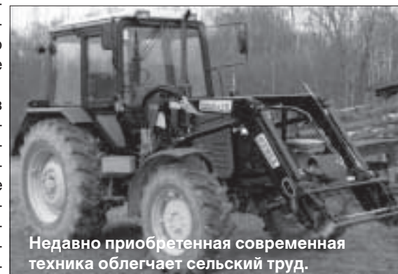
Недавно приобретенная современная техника облегчает сельский труд.