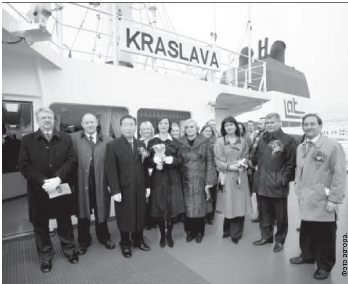
Представители латвийской команды корабля и корейского завода около танкера.