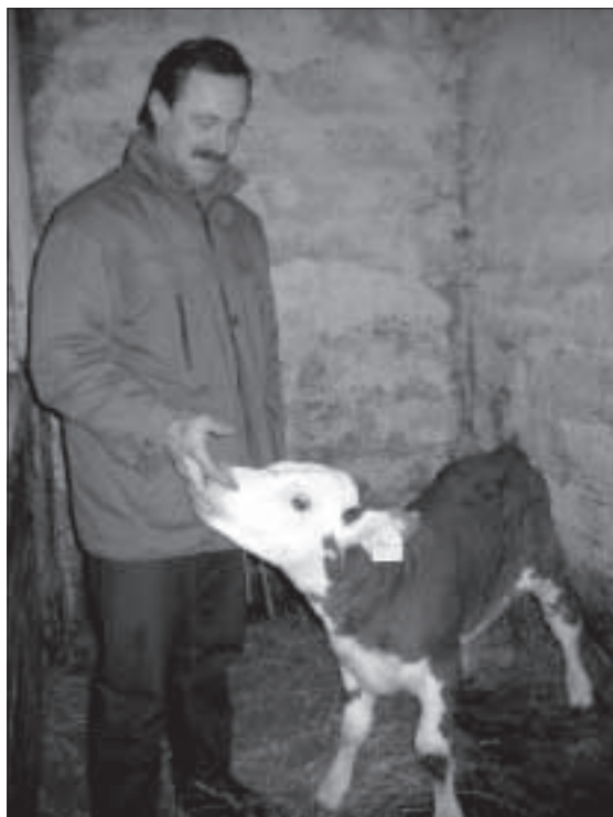
Хозяева планируют держать только крупнорогатый скот.

Раньше на поросятах можно было хорошо заработать, ведь молоко стоило очень дешево, а на поросят был хороший спрос. Держали 6 свиноматок и за год продавали около 70 поросят. Сейчас ситуация изменилась. За молоко в кооперативном хозяйстве «Кауната» платят хорошо и своевременно, зато цены на поросят колеблются от 15 до 20 латов, да и в последние годы хрюшки покупаются плохо. Эта теплая зима для крестьян была