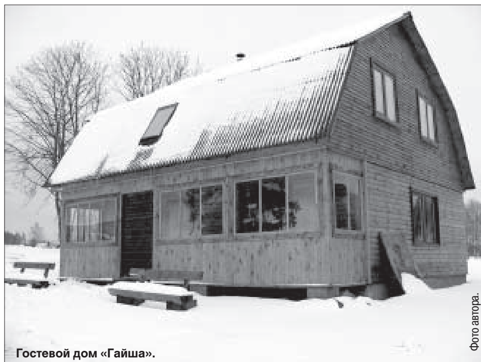
Гостевой дом «Гайша».