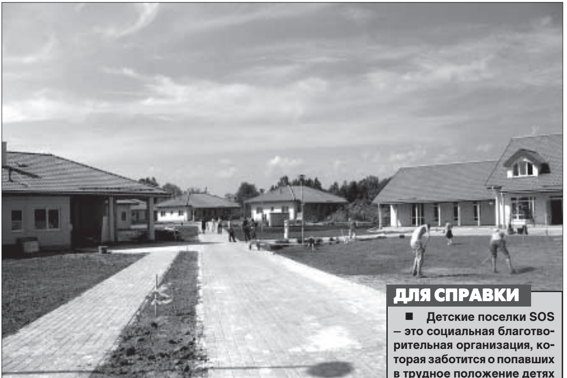
В поселке SOS благоустраивается округ.