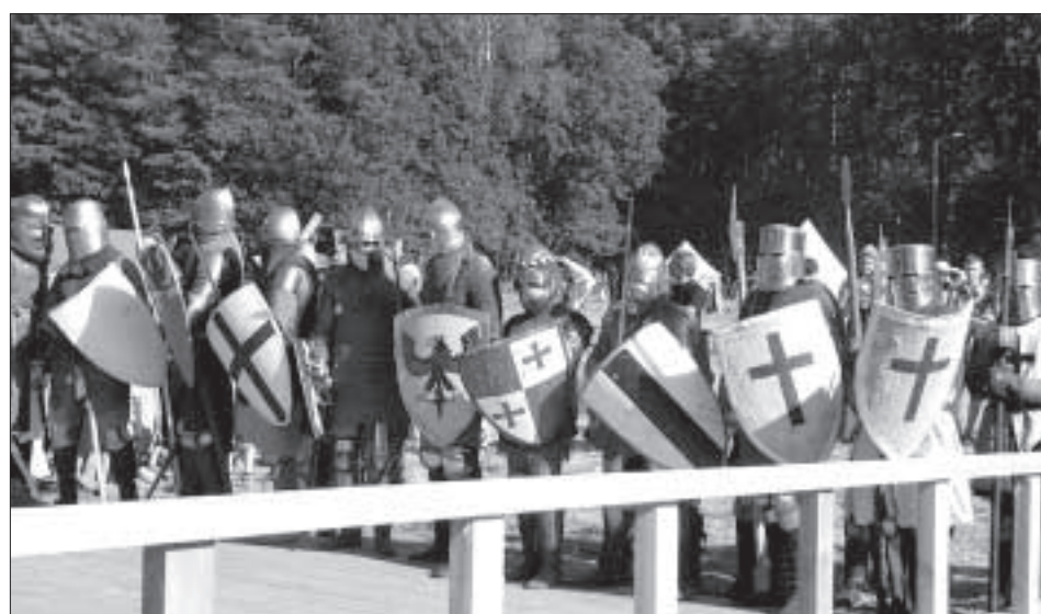
Участники готовятся к решающему сражению.