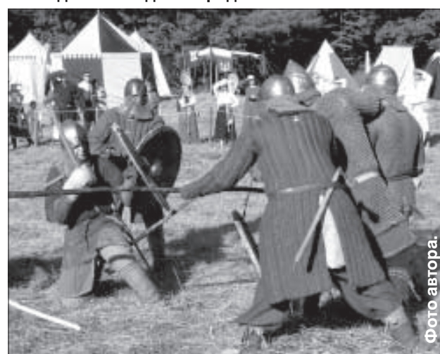
Бугурт рыцарей раннего средневековья.