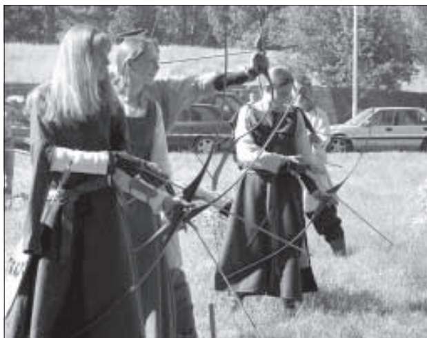
Турнир по традиционной стрельбе из лука.

Нещадно палило солнце. Но выносливые рыцари, несмотря на жару, ходили и сражались в доспехах, которые весят 30 килограммов. Как участники, так и все зрители фестиваля могли по-