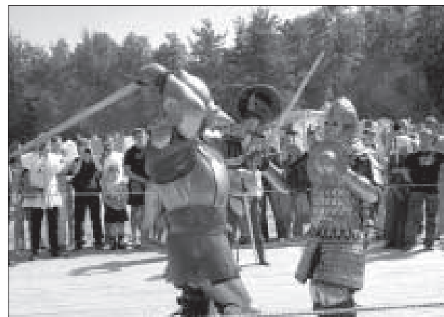
Поединок позднего средневековья.