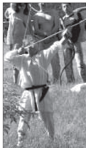
Самый младший участник турнира по традиционной стрельбе из лука.