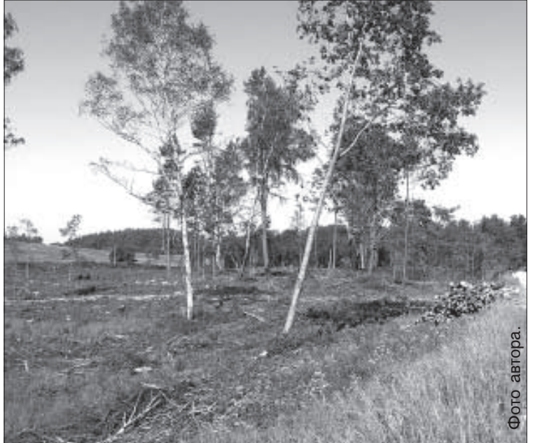
Недавно вырубленный лес.

Одна даугавпилчанка выразила газете свою обеспокоенность тем, что в Демене, Медуми и Лауцесе люди вырубают леса, не думая о том, что эти территории находятся вблизи Игналинской АЭС. Лес был бы первым, кто встанет на пути загрязнения, если на станции случится авария. Даугавпилчанка предложила проводить общественное обсуждение перед тем, как вырубать леса, или определить запретную лесную зону в волостях, которым угрожают различные катастрофы.