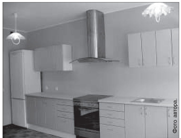
На такой кухне маме SOS будет готовить только в радость.

В Даугавпилсе подобную опеку планируется создать на базе детского приюта «Auseklītis», поселив там две приемные семьи, в каждой из которых будут жить по 12 детей. ■