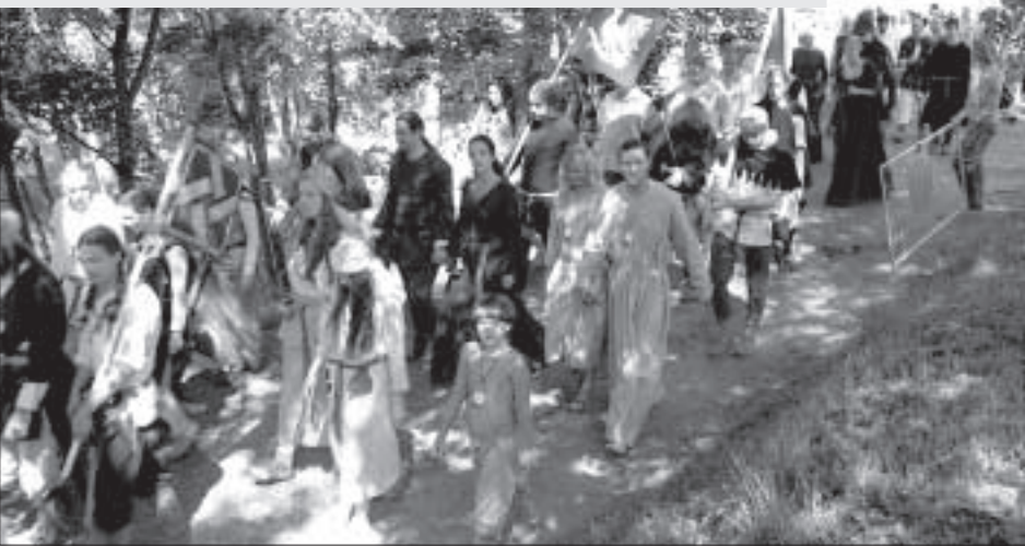
Праздничное шествие участников фестиваля.

Рыцари в блестящих доспехах, красивые дамы и музыка волынок, проникающая прямо в душу. Прекрасный, далекий и непостижимый мир средневековья. Он привлекает нас и зрелищными поединками, и хитрыми интригами. Побывать там, хоть на миг покинуть наш век пластмассы и стать ближе к природе. Кто из нас не хотел бы этого?