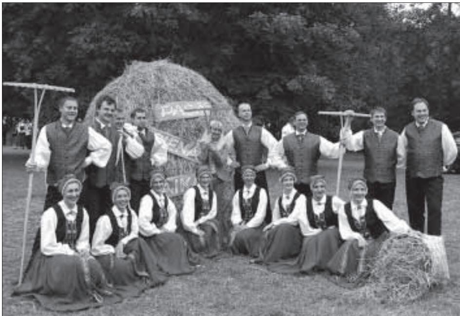
Танцевальный коллектив «Раксти» из Огре, глядя на фотографии, будет вспоминать веселую уборку сена в Латгалии.