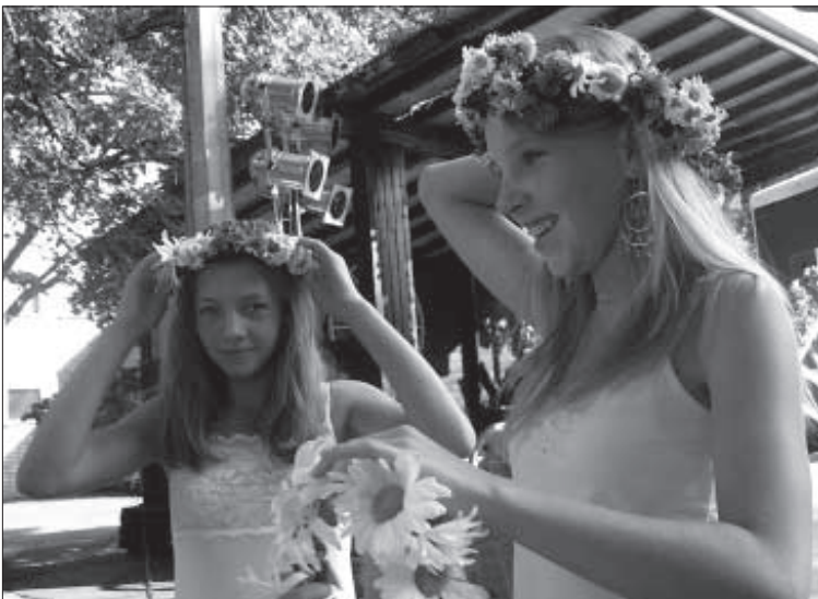
К выступлению готовится коллектив линейного танца из Ницгале.