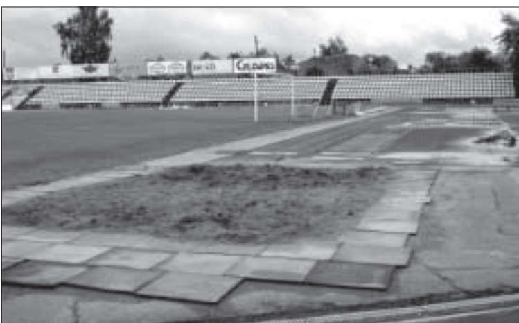
Опасная для здоровья легкоатлетов прыжковая яма.

В Даугавпилсе способные девушки и юноши занимаются лёгкой атлетикой в своё удовольствие. Наши легкоатлеты прибавляют в результатах, но в определённый момент наступает застой, который при сложившейся ситуации преодолеть трудно. Пока же ожидать от наших спортсменов высоких результатов не стоит.