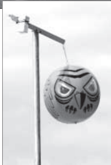
Шары со своеобразными птичьими головами отпугивают чаек.

По прогнозам Айвара Пуданса, члена правления Южно-Латгальской межсамоуправленческой организации по утилизации