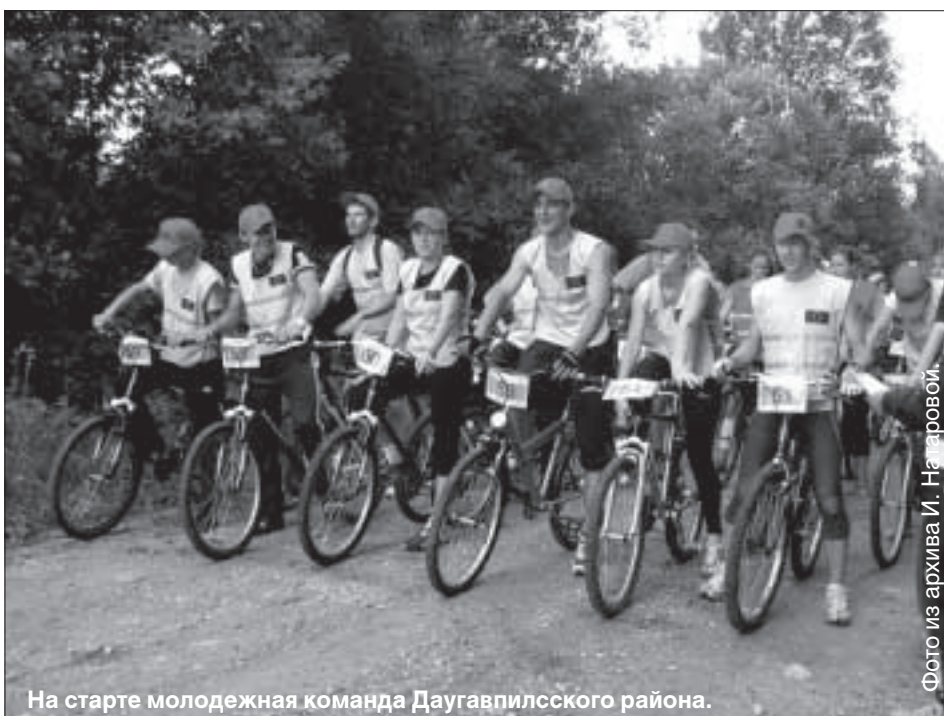
На старте молодежная команда Даугавпилсского района.