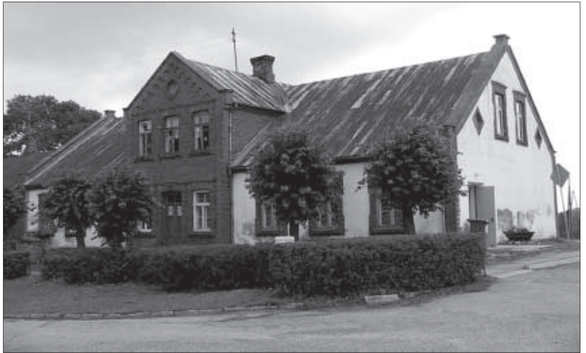
Одно из старейших зданий школы.