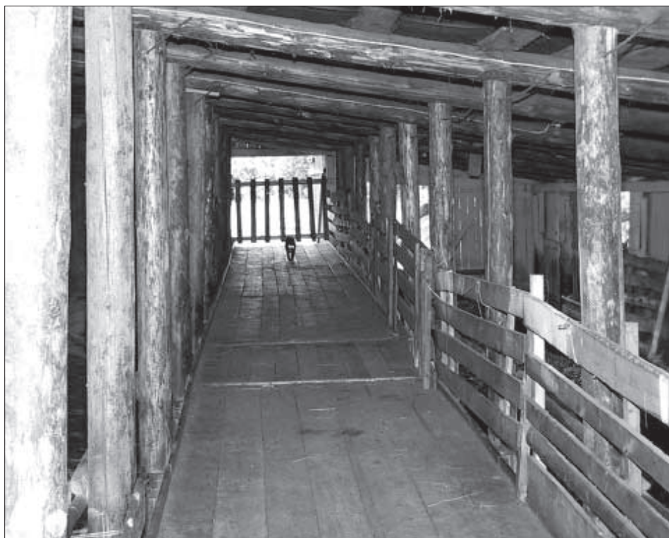
Такие фермы у овцеводов Австралии.

«Для баранины необходимы приправы: лавровый лист, чеснок, базилик. Никогда не пользуйтесь уксусом, он испортит еду. Очень вкусное мясо 6-8 месячного ягненка, зажаренное на гриле. Приятно — ангар для сельскохозяйственной техники. Есть