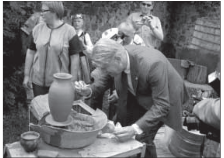
На память керамисту остается автограф президента Латвии.