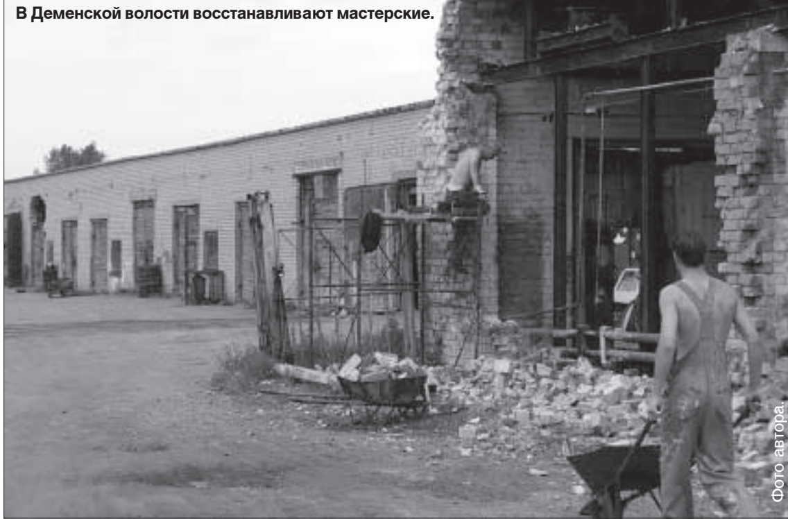
В Деменской волости восстанавливают мастерские.

Более 160 000 латов запланировано на ремонт амбулаторий, аптек и социальных центров, а также для создания социальных квартир.