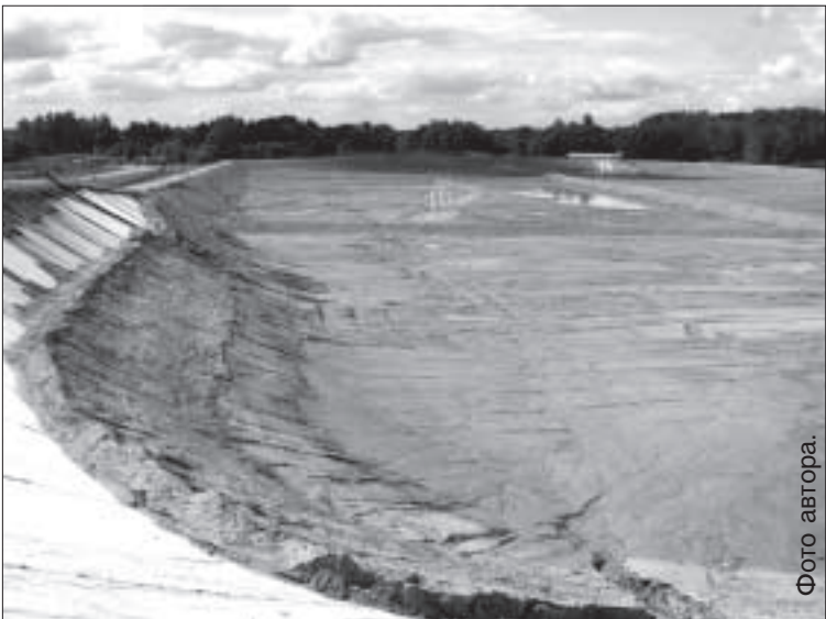
В этой яме — ячейке отходы будут храниться в течение 9 лет.