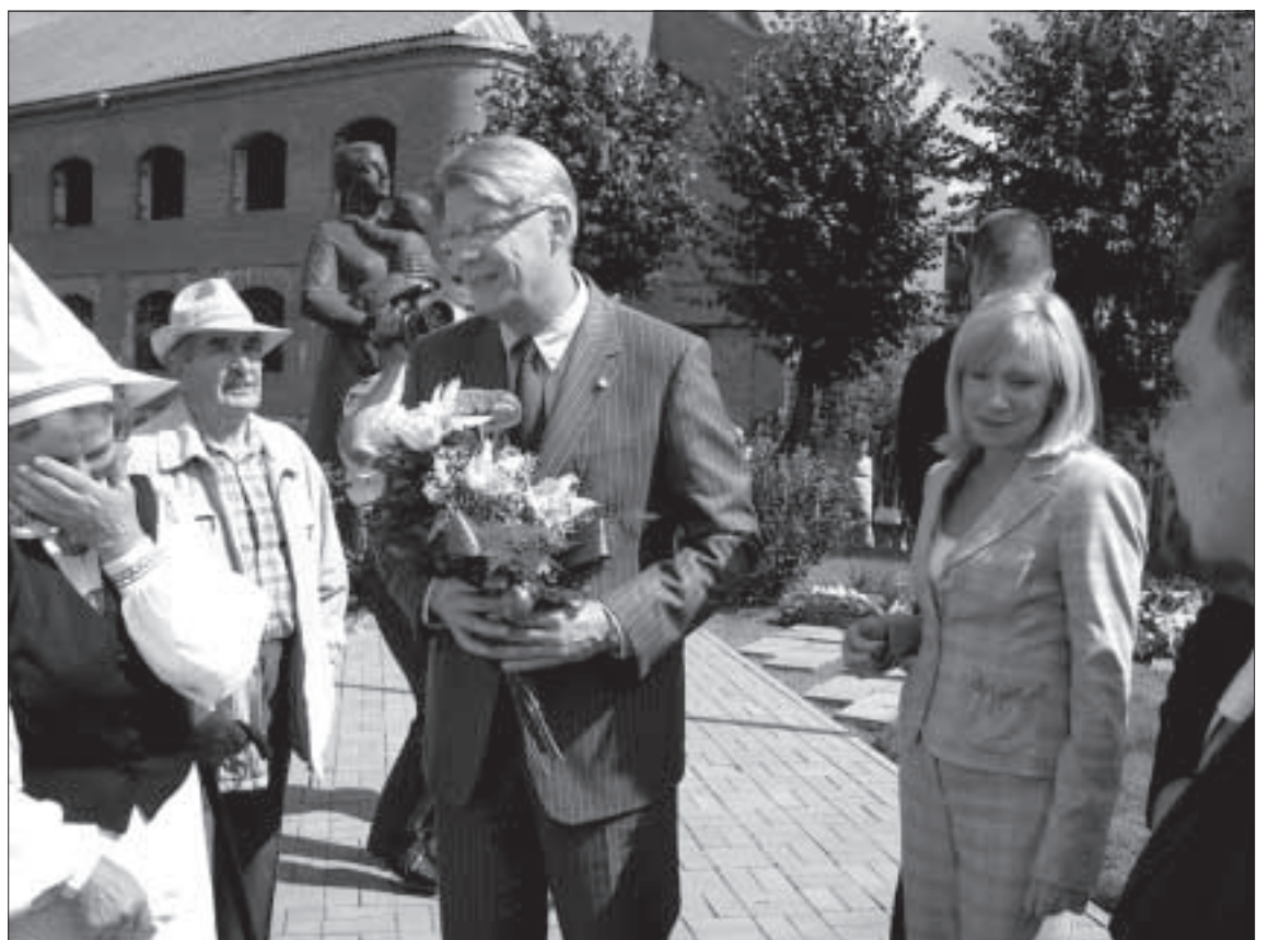
Президент беседует с жителями после возложения цветов у памятника «Мать-Латгалия плачет».