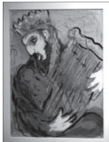
Работа Марка Шагала «Давид с арфой».

— уже рядом, теперь нам самим нужно подойти к нему поближе».