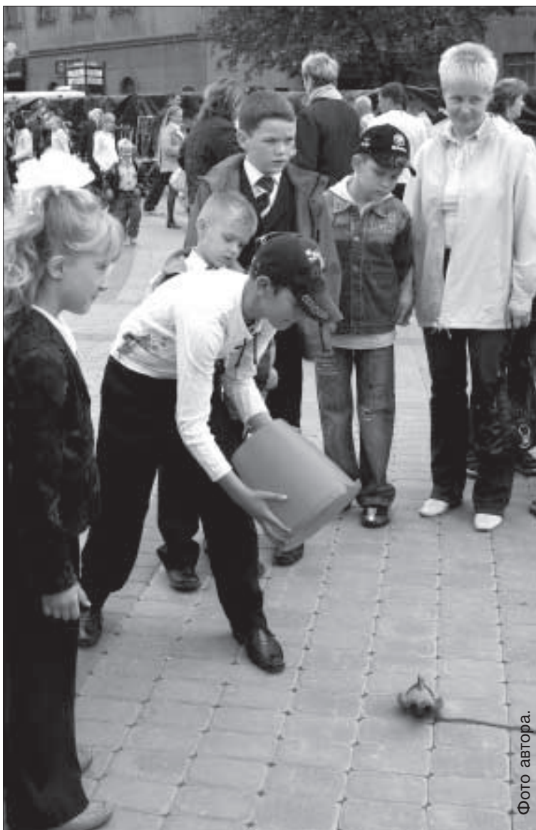
Молодежь проявляет свою ловкость в аттракционах.