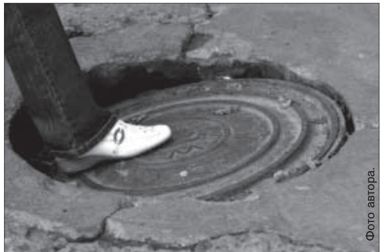
Обвалившиеся колодцы на ул. Ригас и вблизи нее.

которые колодцы действительно находятся в аварийном состоянии и дожидаться реконструкции улицы нельзя, поскольку процесс обвала продолжится и может очень печально закончиться для кого-нибудь из пешеходов. Он обещал, что ответственные службы в ближайшее время исследуют эти объекты и починят колодцы, чтобы они не угрожали безопасности пешеходов.