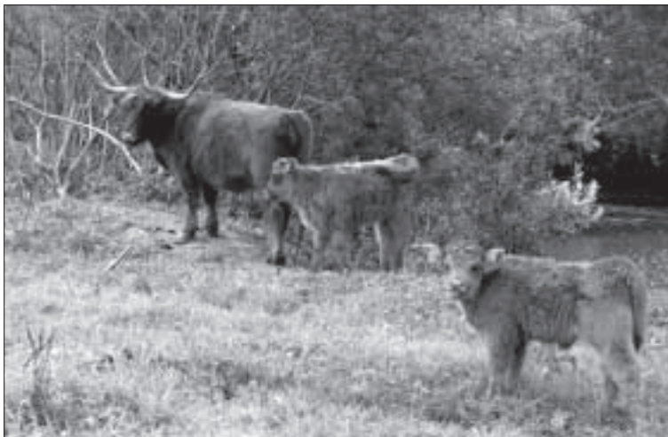
К семье диких коров прибавилось 11 телят.