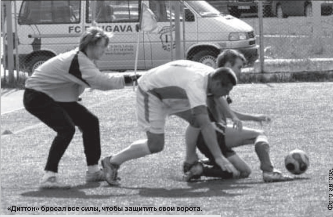
«Диттон» бросал все силы, чтобы защитить свои ворота.