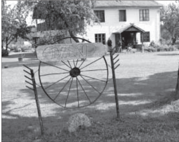
С дороги открывается красивый вид на дом в хозяйстве «Dzeņi».