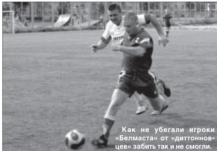
Как не убежали игроки «Белмаста» от «диттоновцев» забить так и не смогли.

Даугавпилса. «Рейнис», занявший первое место, автоматически начинает кубок с полуфинальной стадии, где будет ждать победителя пары «Курши» — «Нортекс». Другие пары четвертьфиналистов: «ЛРЦ/ДЮСШ» — «Белмаст» и «Диттон» — «Муниципальная полиция». Финал состоится 23 сентября. ■