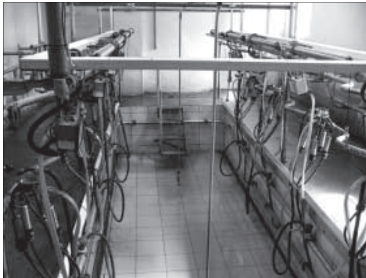
Зал для дойки коров отвечает всем требованиям ЕС.