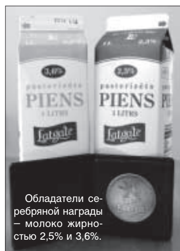
Обладатели серебряной награды – молоко жирностью 2,5% и 3,6%.

Эгита-Терезе Йонане На прошлой неделе АО «Latgales piens» приняло участие в конкурсе на лучшее пастеризованное молоко, организованном Латвийским центральным союзом производителей молока и международной выставкой «Riga Food 2007». Даугавпилчане завоевали два вторых места – за пастеризованное молоко с жирностью 2,5% и пастеризованное молоко с жирностью 3,6% и серебряную медаль международной выставки «Riga Food 2007» за качество пастеризованного молока с жирностью 2,5%.