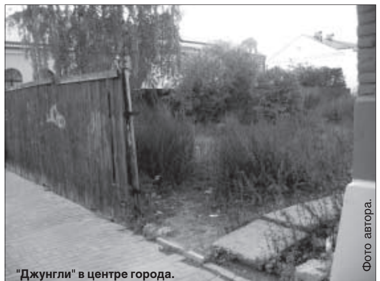
"Джунгли" в центре города.