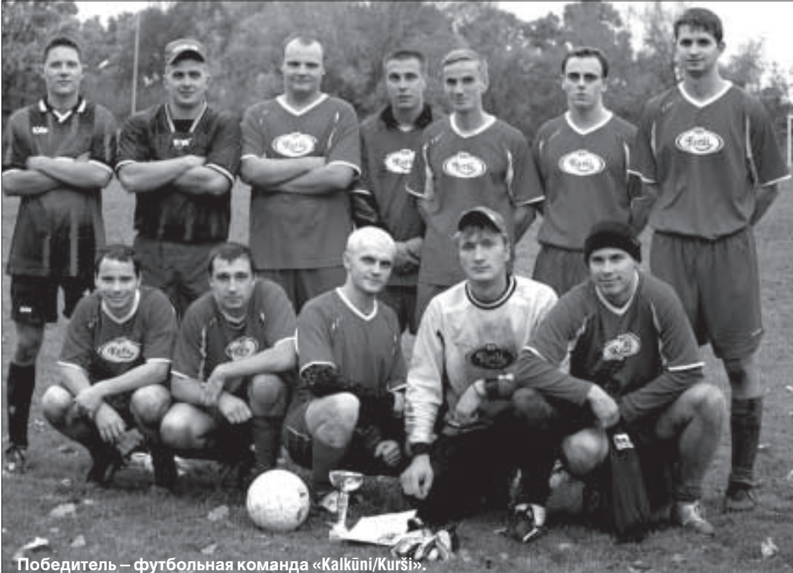
Победитель – футбольная команда «Kalkūni/Kurši».