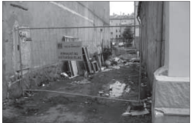
Такой вид можно наблюдать с ул. Михоэlsa.