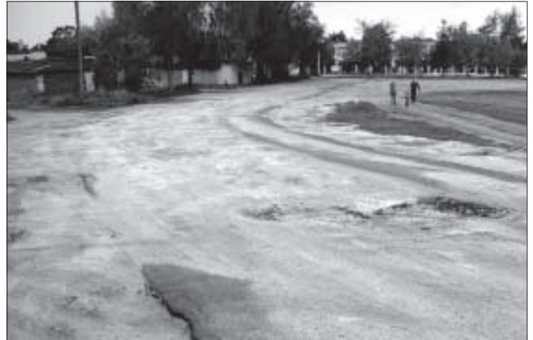
Участок перед ДБДД.