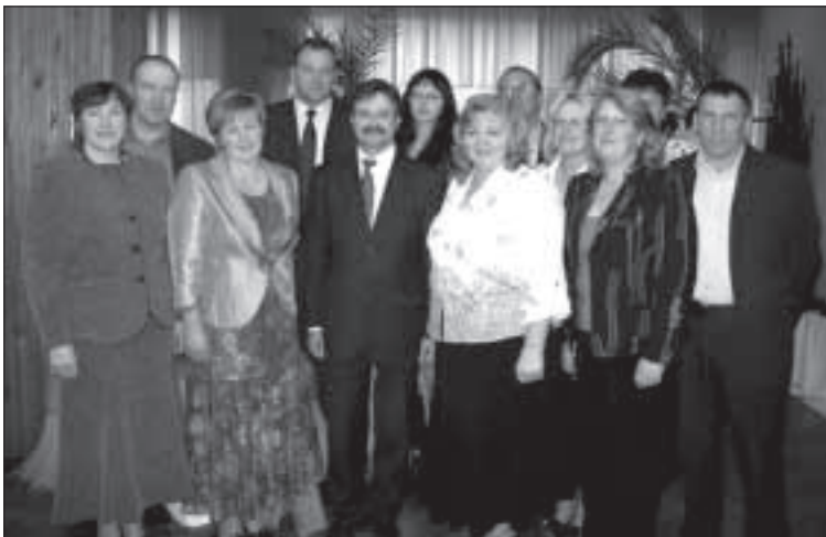
Встреча министра с крестьянами и представителями самоуправления.

Это будет последний год, когда для льноводства выделяются дополнительные платежи от государства за площадь, но ми-