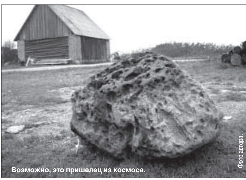
Возможно, это пришелец из космоса.

Наконец, Зента — человек практичный в том, что касается сельского хозяйства, но тем не менее не утративший в душе чувства прекрасного, решила на месте фундамента бывшей башни соорудить цветочную клумбу, что и сделала, украсив, таким образом двор. Для декорирования клумбы хозяй-