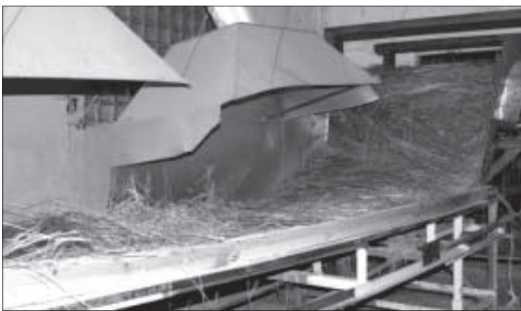
Краславский льнозавод снова заработал после годового простоя.

нистр обещал, что в дальнейшем будет поддержка, как для внедрения технологий, так и платежи за площадь.