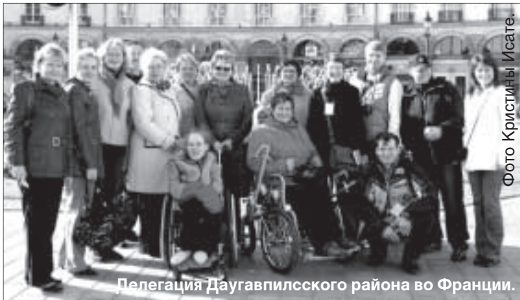
Делегация Даугавпилсского района во Франции.