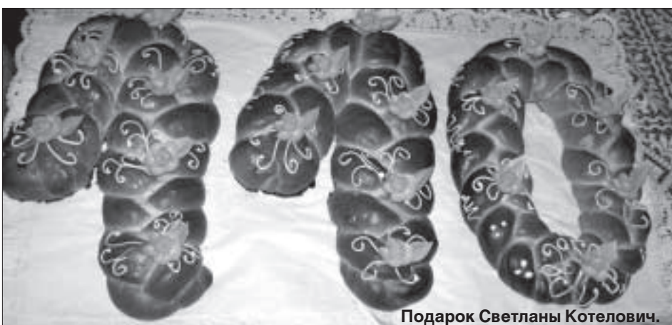
Подарок Светланы Котелович.