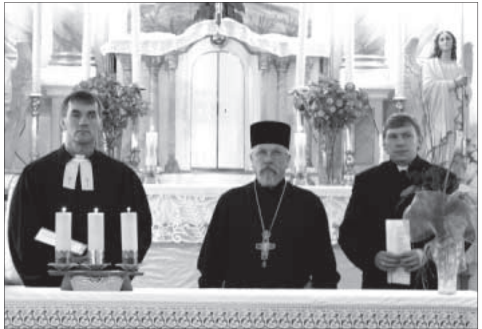
Богослужение в Яунборнском костеле.