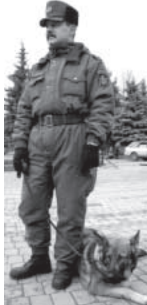
Собака на границе — незаменимая помощница.

лось 10 лет, что является приличным возрастом для собаки, но она успешно сдала все тесты и продолжает служить на границе и занимается поиском наркотических средств. Также у собак есть и своя специализация: одни практикуются на поиске запрещённых веществ, другие идут по следу правонарушителя границы.