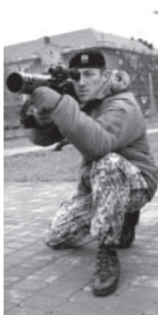
Новая пиксельная форма.

Пограничники, кроме оружия и техники, используемой на границе, демонстрировали возможности своих четвероногих напарников. Собаки разных размеров и пород, как и люди, должны сдавать экзамены, чтобы продолжать службу. Коккер-спаниелю Ладе уже исполни-