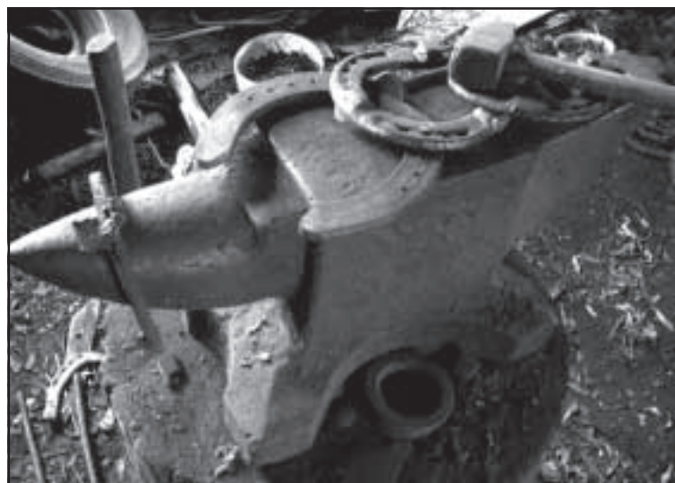
Подкова Пончика — на счастье.