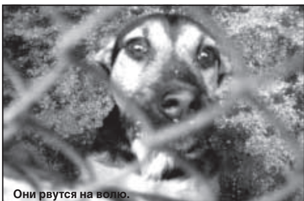
Они рвутся на волю.

"Есть люди добрые, но порой встречаются очень жестокие. Для них животное словно игрушка: захотят — пожалеют, не захотят — выбросят. Так ведь нельзя!" — говорит Ренат Ечис.