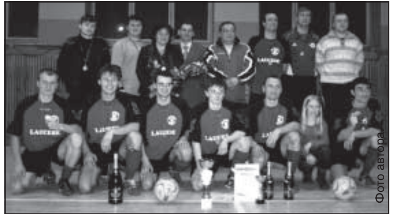
Чемпионы Даугавпилса по футзалу 2008 «Лауцесе».

В субботу, 2 февраля, завершился чемпионат Даугавпилса по футзалу. Несмотря на то, что чемпион был известен заранее – команда «Лауцесе», финальный тур тоже преподнес свои сюрпризы.