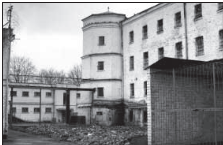
В этом переднем дворе планируется сделать спортивную площадку для заключенных.

В Гривской тюрьме, где на данный момент работает почти каждый третий эков, еще сравнительно много свободного места и возможностей для трудоустройства.