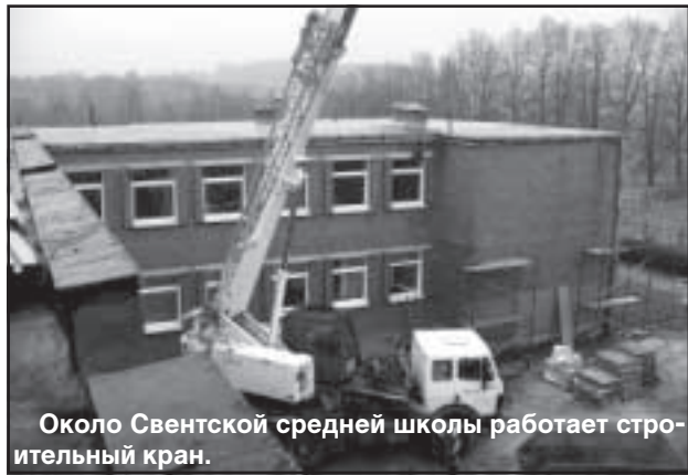
Около Свентской средней школы работает строительный кран.