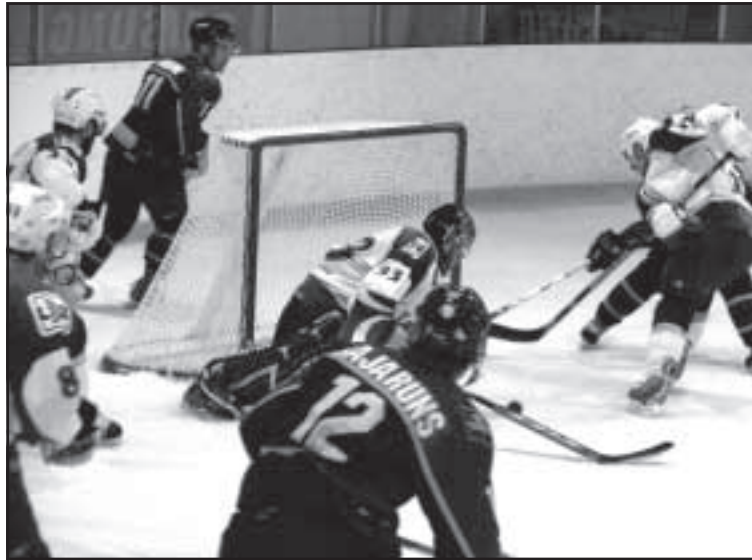
Бой у ворот латгальцев.