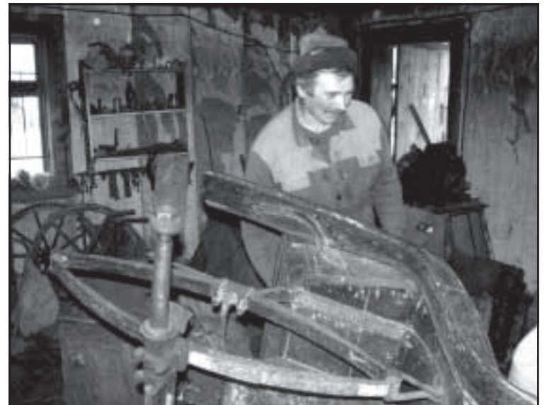
Линейка скоро встанет на колеса.

бегали по загону, на ходу утыкаясь бархатными губами в руки своего хозяина.