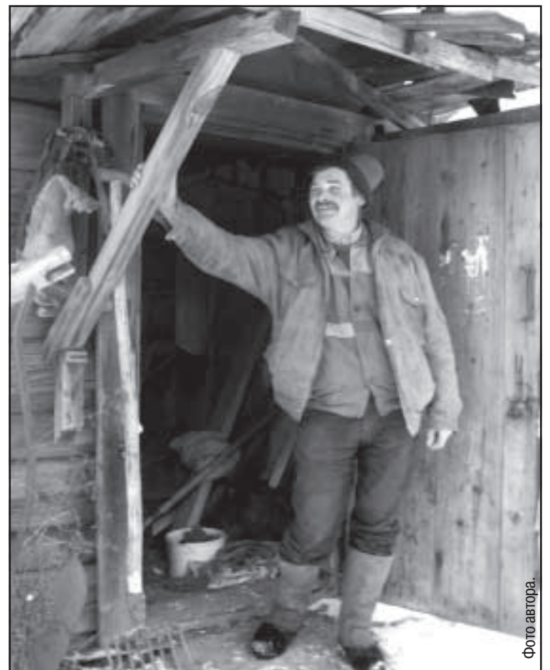
На пороге кузницы.