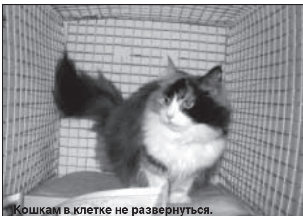
Кошкам в клетке не развернуться.