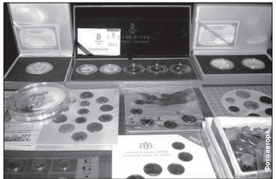
Сувениры предстоящей Олимпиады.

На выставке были представлены пользующиеся сейчас особой популярностью открытки с изображением городов Латвии и Европы, которые датированы началом прошлого