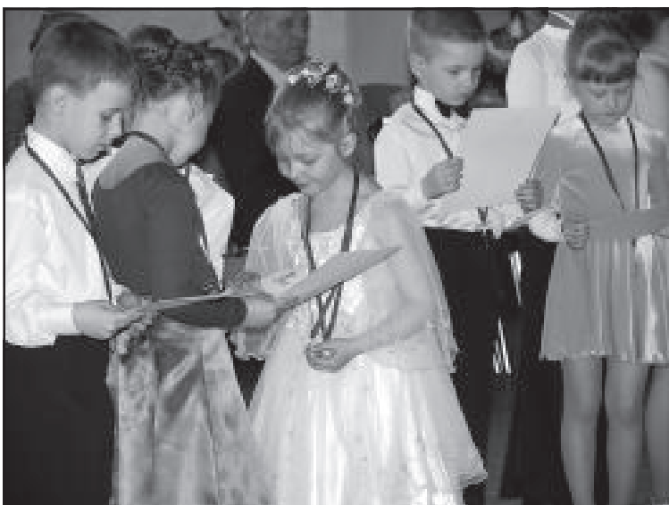
Награды достойны изучения и обсуждения.