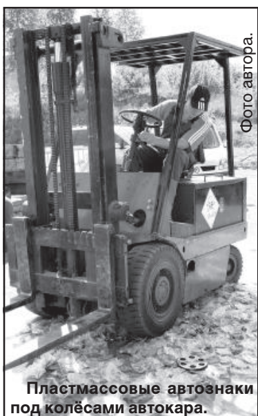
Пластмассовые автознаки под колёсами автокара.

единиц пластмассовых эмблем таких автомобильных марок, как «Audi», «Chevrolet» и «Jeep». Весь контрафакт был раздавлен под колёсами шеститонного электрокара и отправлен на свалку. Отдельно стоит отметить, что в коробках знаки были завернуты в газету на китайском языке, что является косвенным свидетельством того, что эта сомнительная продукция проделала неблизкий путь.