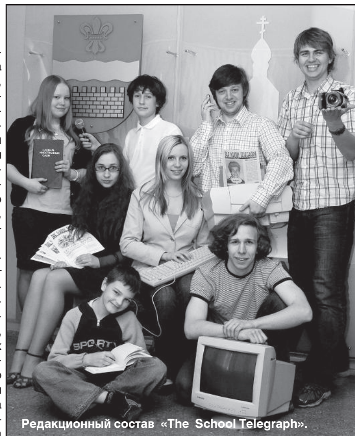
Редакционный состав «The School Telegraph».

– Школьная газета должна быть интересной в первую очередь. В школе и так много всего серьезного: уроки, домашние задания, собрания. Газета призвана развлекать эту серость будней и показывать школьную жизнь с иного ракурса. Например, я сама часто пишу свои материалы и как бы