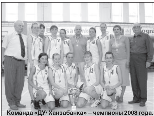
Команда «ДУ/Ханзабанка» — чемпионы 2008 года.

Завершился чемпионат Латвии в женской любительской баскетбольной лиге. Более чем полгода девушки из команды «ДУ/Ханзабанка» боролись за победу. На протяжении регулярного чемпионата даугавпилчанки не знали поражений, а самым трудным выдались полуфиналы и финал.