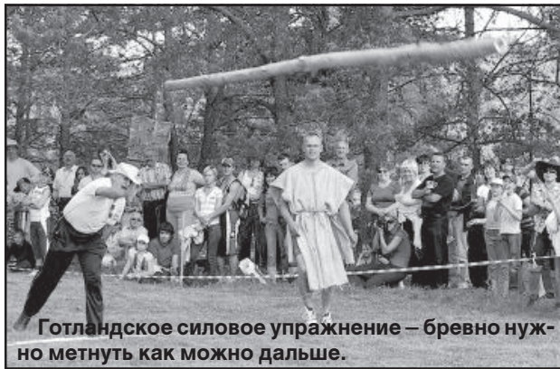
Готландское силовое упражнение – бревно нужно метнуть как можно дальше.

Затем готландские атлеты и зрители отправились на луг, где состоялись традиционные готландские