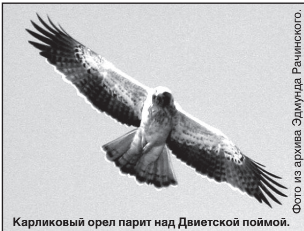
Карликовый орел парит над Двиетской поймой.