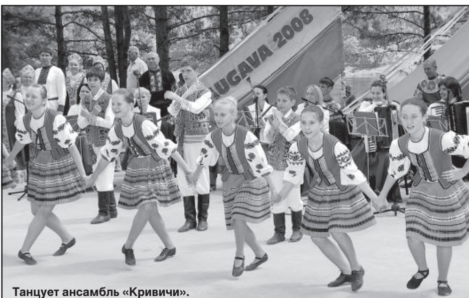
Танцует ансамбль «Кривичи».