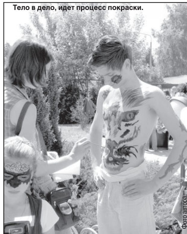
Тело в дело, идет процесс покраски.