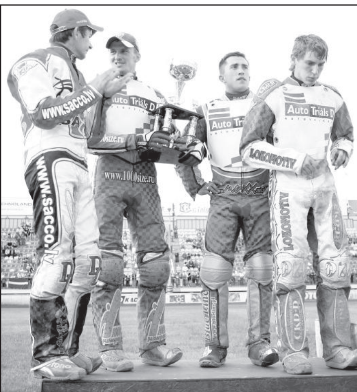
Команда СК «Локомотив».