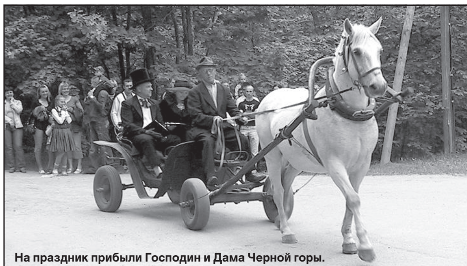
На праздник прибыли Господин и Дама Черной горы.