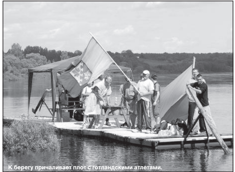
К берегу причаливает плот с готландскими атлетами.

игры. Здесь были захваты-вающие силовые упражнения с веревкой, бревном и металлическим диском. Победу сумели завоевать и зрители, поэтому руководители соревнований могут смело сказать, что в Латгалии живут силачи.