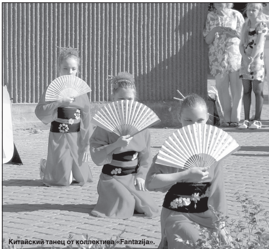
Китайский танец от коллектива «Fantazija».

пока команды трудятся над созданием новых шедевров, каждая из них должна была выкроить время, чтобы презентовать себя. В основном команды состояли из детей, посещающих различные творческие кружки в Доме творчества. На презентации они демонстрировали то, чему их научили. Родители могли