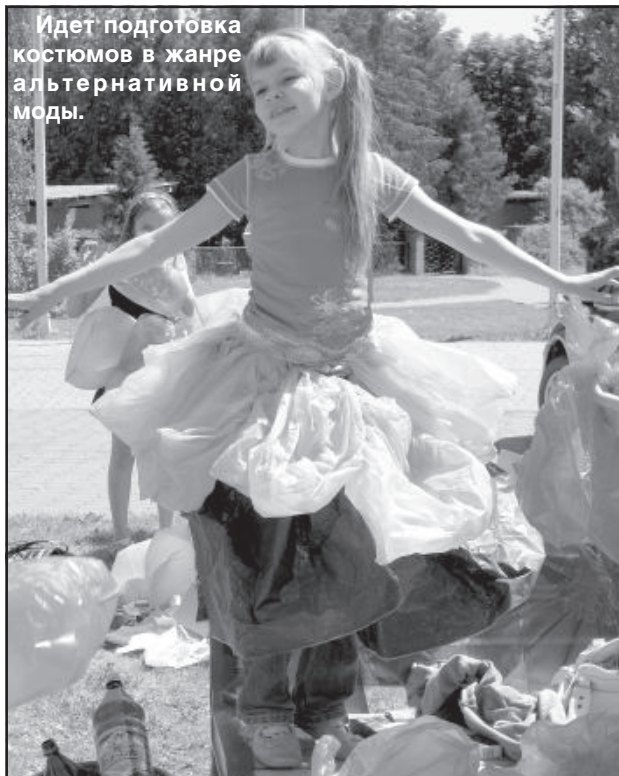
Идет подготовка костюмов в жанре альтернативной моды.

Завершал праздник концерт «Piks rīka», на котором свое умение петь и танцевать демонстрировали маленькие дети. ■