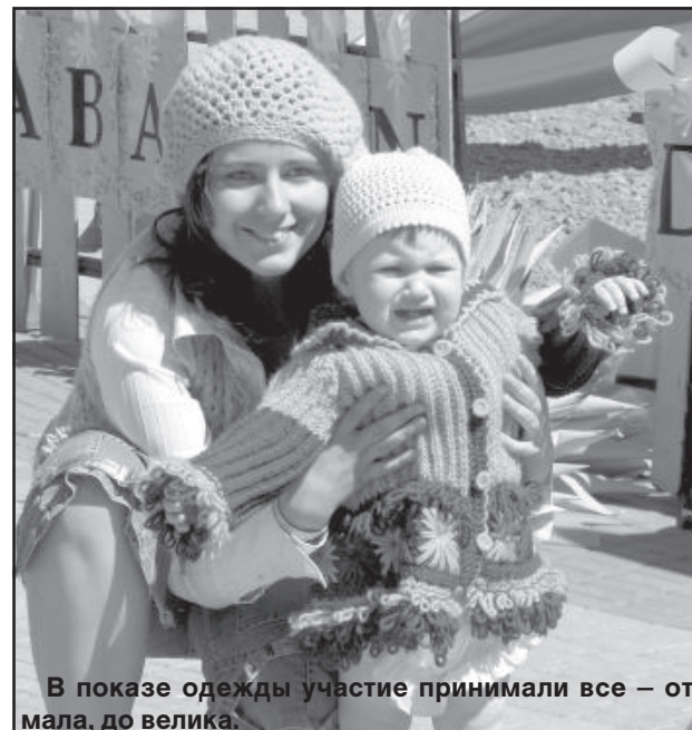
В показе одежды участие принимали все — от мала, до велика.

Ольга Егорова Каждый ребенок знает, что первый день лета — это его день, так как с 1950 года во всем мире 1 июня отмечается Международный день защиты детей. Этот праздник не знает границ и национальностей, его отмечают везде, где раздаются детские голоса. В этот день они важнее всех остальных.