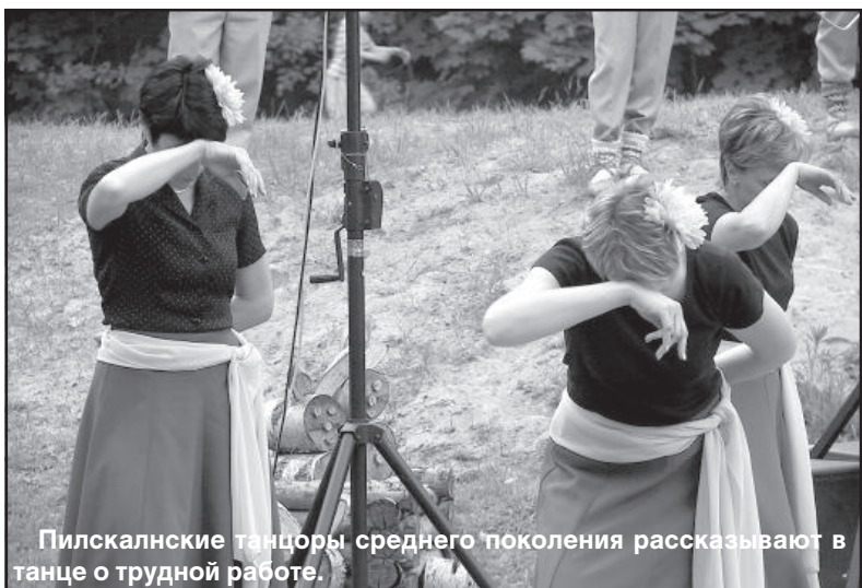
Пилскальские танцоры среднего поколения рассказывают в танце о трудной работе.