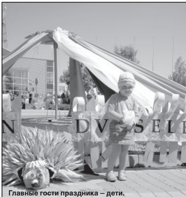
Главные гости праздника — дети.