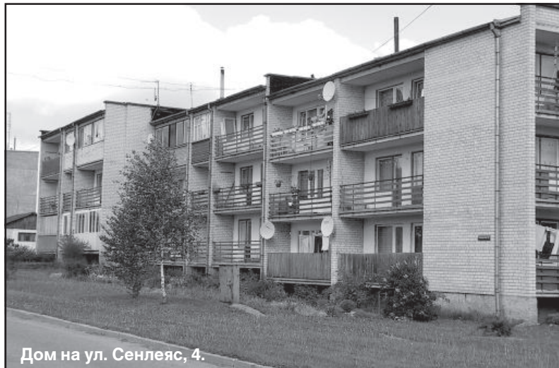
Дом на ул. Сенлеяс, 4.