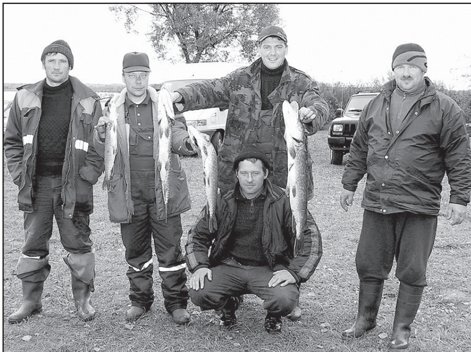
В командном зачете первые два места у вишских рыболовов.