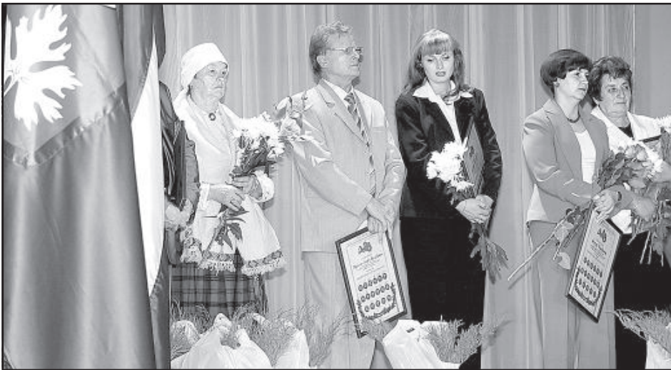
Победители конкурса – жители Науене.