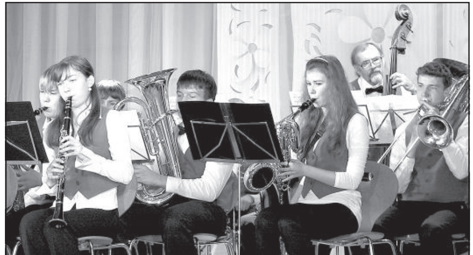
Выступает Науенский духовой оркестр.