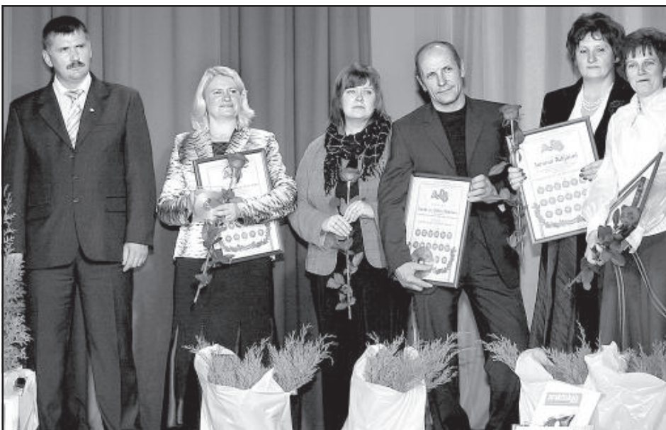
Награду получили жители Берзгальской волости.