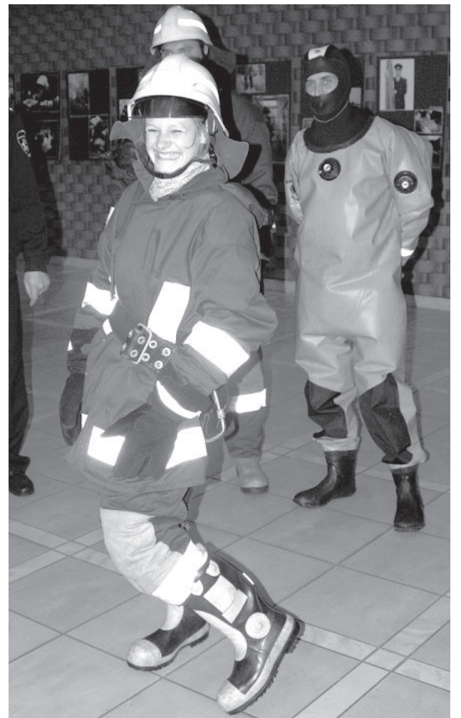
Некоторым школьникам удалось примерить 30-килограммовые «доспехи» пожарных.

Перед кинотеатром выставлены служебные автомобили полицейских, катер, на котором водная полиция патрулирует озера и реки Латгалии.