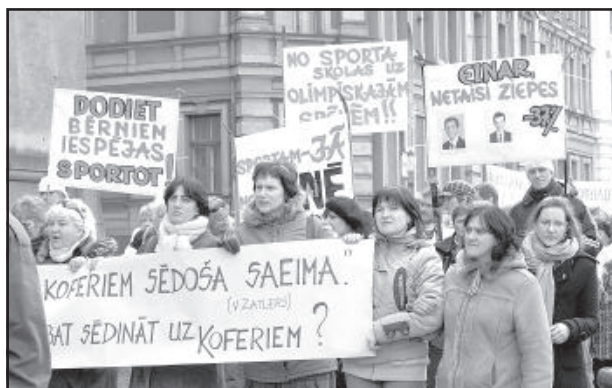
Латвийские учителя доведены до отчаяния.