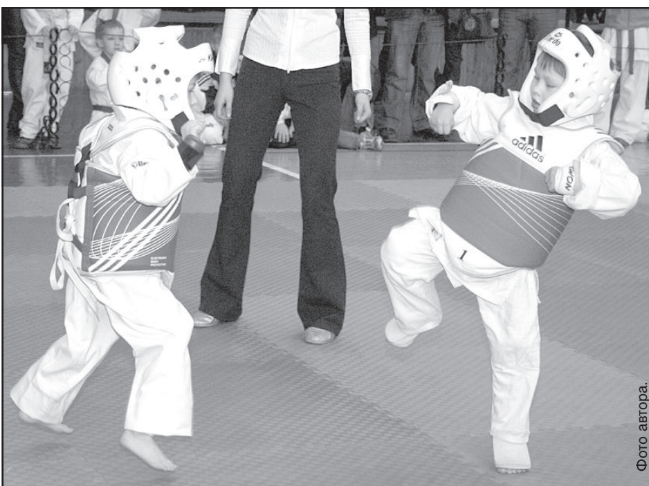
Самые юные участники «Daugavpils Cup 2009».