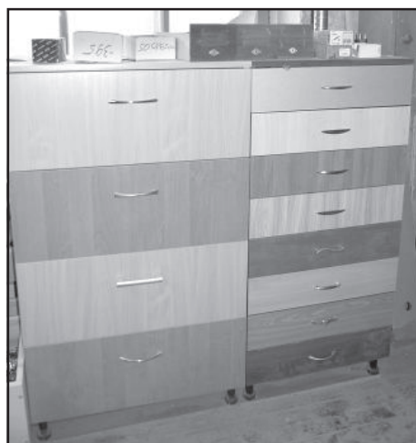
Шкафчик — клиент может выбрать ящики нужного размера и цвета.