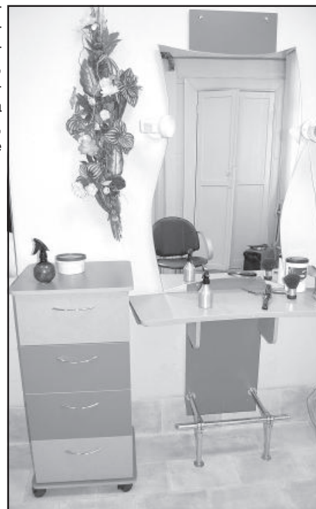
Мебель «Лубаны» для парикмахерской.