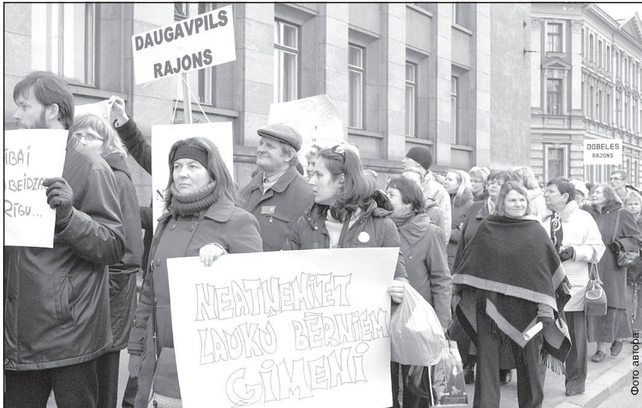
Представители Даугавпилсского района во время марша протеста.