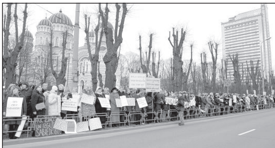
В шествии приняли участие более 10 тысяч человек.

Различные плакаты и лозунги наглядно демонстрировали то, что сейчас происходит в душах людей профессий образовательной сферы: «Министры, поживите на нашу зарплату!», «Репше, хватит лить воду!», «Мы тоже хотим есть, и у нас тоже есть семья!», «Мы не хотим платить за ошибки