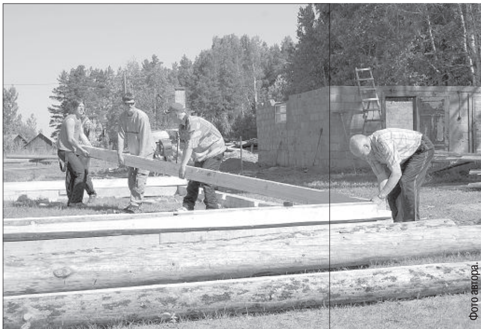
Восстанавливают сгоревший хлев.