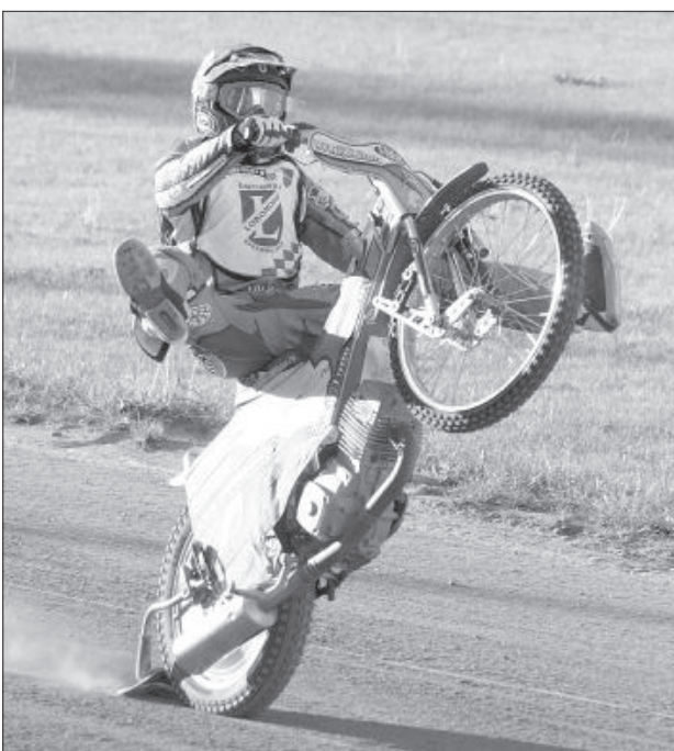
После гонки и заслуженной победы гонщики на радость болельщиков позволили себе похулиганить.

Вторую победу подряд праздновали гонщики и болельщики спидвейного клуба «Локомотив», обыгравшие 31 мая вице-лидеров «RKM ROW» из Рыбника – 59:34. Несмотря на поражение, гости сохранили своё место в турнирной таблице. Даугавпилсская команда поднялась на одну строчку выше, расположившись теперь не третьей.