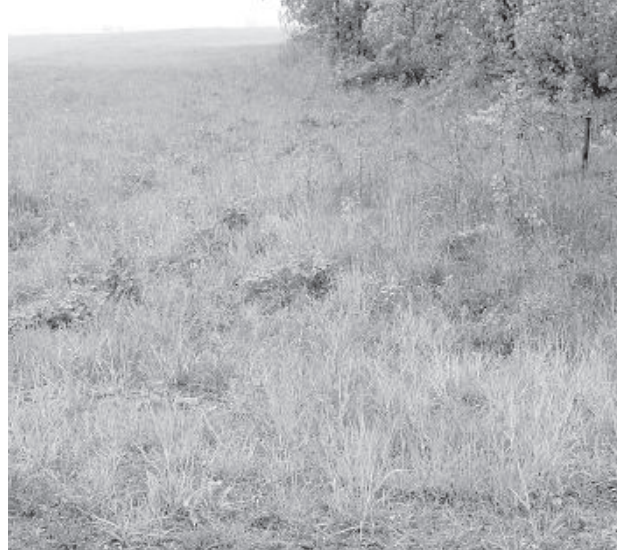
Однажды дорога, ведущая в «Калнишки», просто исчезла.

Самое интересное, что в «Калнишки» вели не только упомянутые