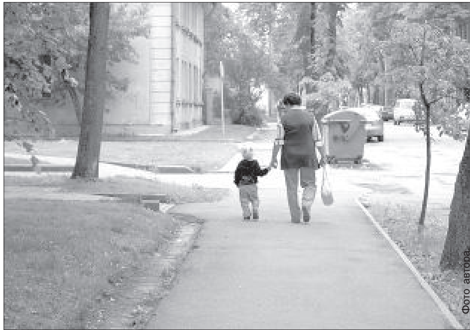
Что ждет латвийских детей и пенсионеров — решать правительству.

Даце Рация советует при выборе руководствоваться близостью того или иного банка к месту жительства, его филиалов, наличия банкоматов недалеко от дома, величиной комиссионной платы за