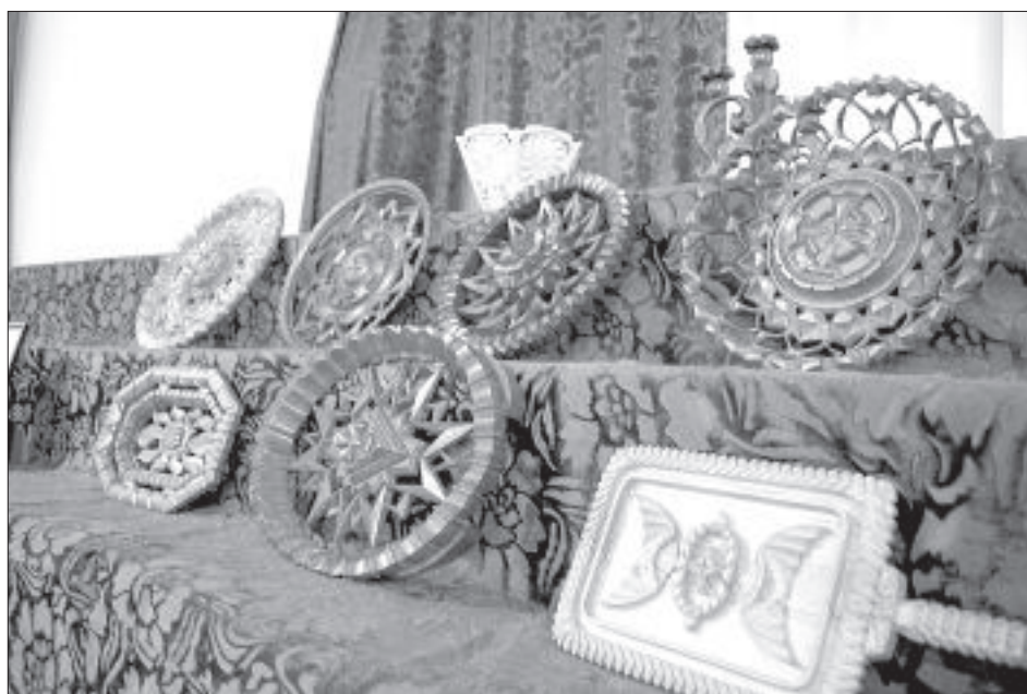
Деревянные изделия потомственного казака.