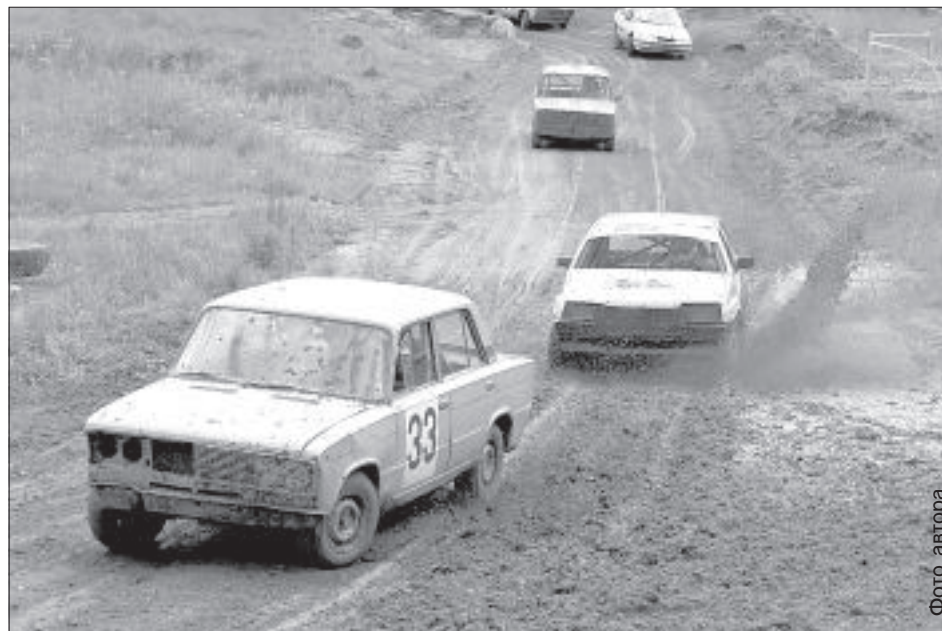
На трассе шла напряженная борьба.