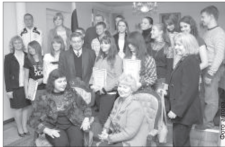
Будущие экскурсанты с удовольствием согласились сфотографироваться.

8 июня в Генконсульстве РФ в Даугавпилсе состоялось награждение победителей конкурса по истории «Имя России: взгляд из Латвии». Работы принимались почти месяц, начиная с 23 апреля, и награда была достойная – путешествие во Псков и Великий Новгород. Организаторы, а это Генконсульство России, Даугавпилсский университет и управление образования Даугавпилсской думы, получили более 40 работ от школьников со всей Латгалии.