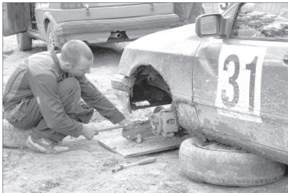
Техобслуживание перед стартом.