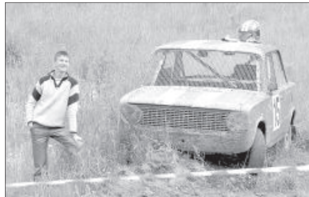
Из-за небольших аварий некоторым участникам пришлось покинуть трассу.