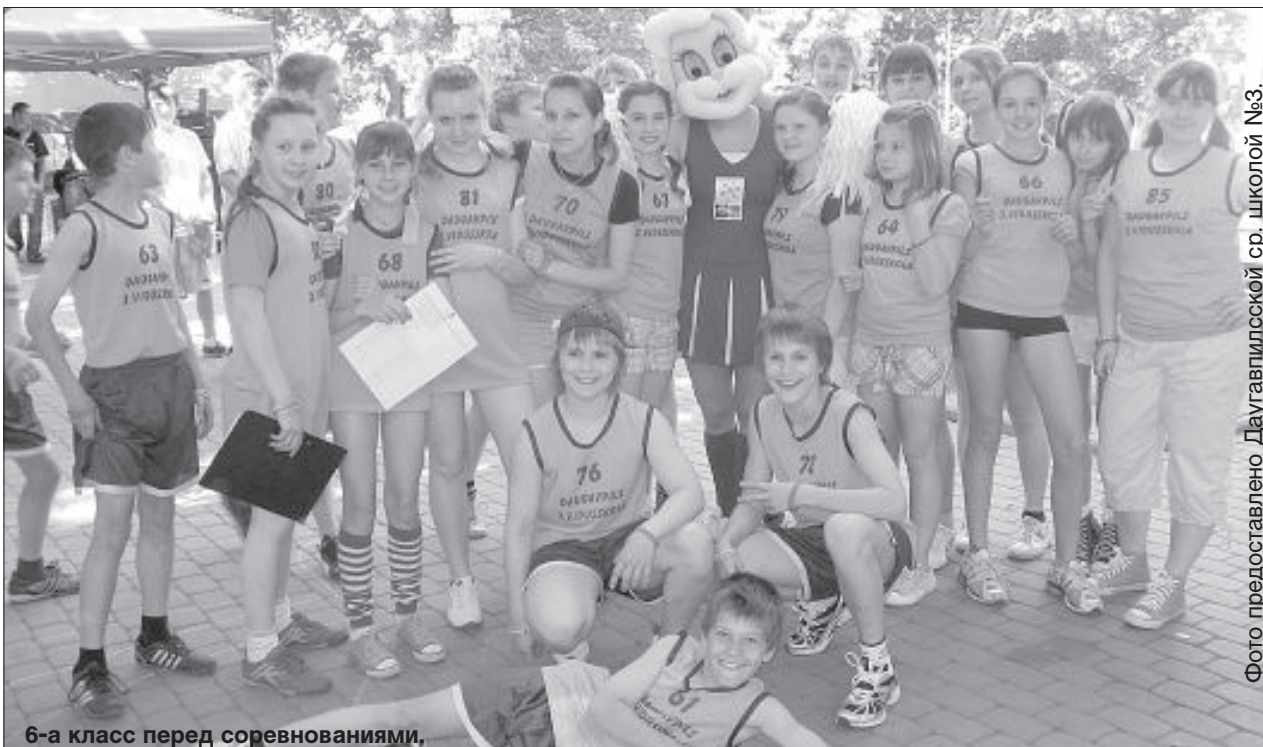
6-а класс перед соревнованиями.