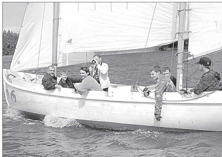
Даугавпилские яхтсмены отправляются в путь.

Яхта даугавпилчан называлась «Zero Losia» (с