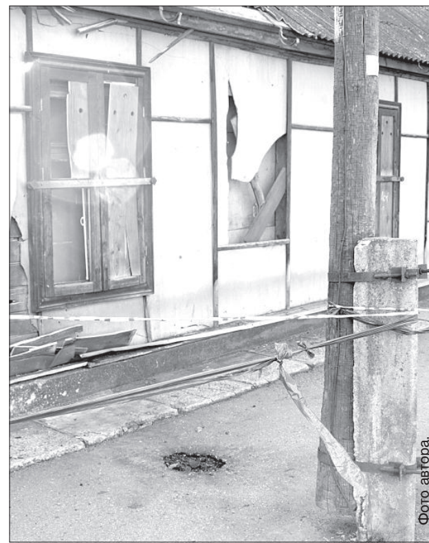
После того, как полиция сняла оцепление, жильцы сами огородили пострадавший участок.

До 2003 года в Даугавпилсе было свое подразделение саперов, но затем его ликвидировали. На данный момент при обнаружении взрывных уст-