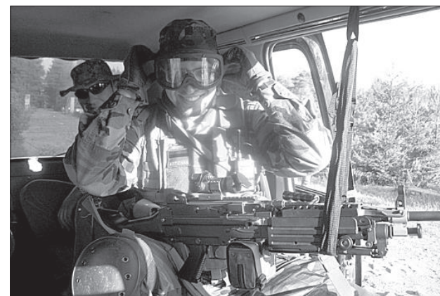
Военные всегда действовали под прикрытием тяжелой техники.

Официально на мероприятии было три языка общения – русский, английский и эстонский, но игроки всегда могли договориться, объясняясь на пальцах (антураж игры от этого только выигрывал). Участники игры действовали как в одиночку,