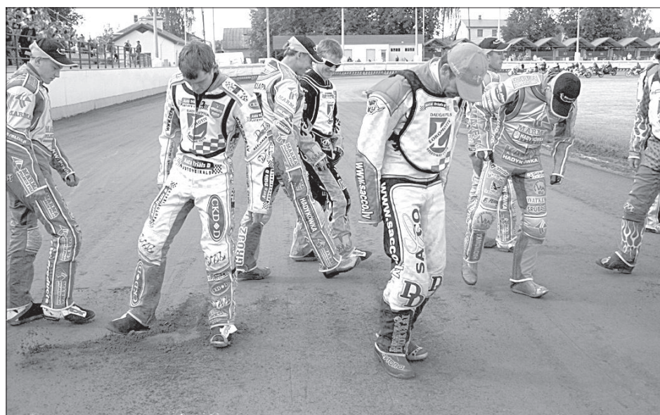
Традиционно перед заездом гонщики готовят стартовую зону.