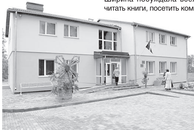
В восстановленном здании теперь находятся общественный центр и библиотека.

Очень точно сказала учительница Бирзниежской ос-