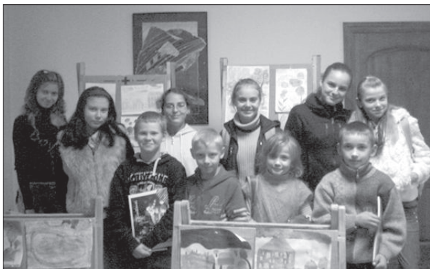
Победители конкурса «Мой поселок Медуми».