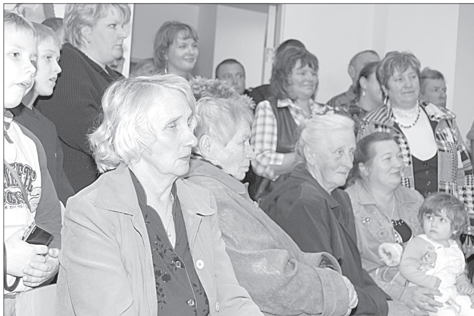
На народный праздник собрались дети, молодежь, семьи, пенсионеры.

Жители Лауцесе решили в ближайшее время оборудовать около центра детскую игровую площадку.