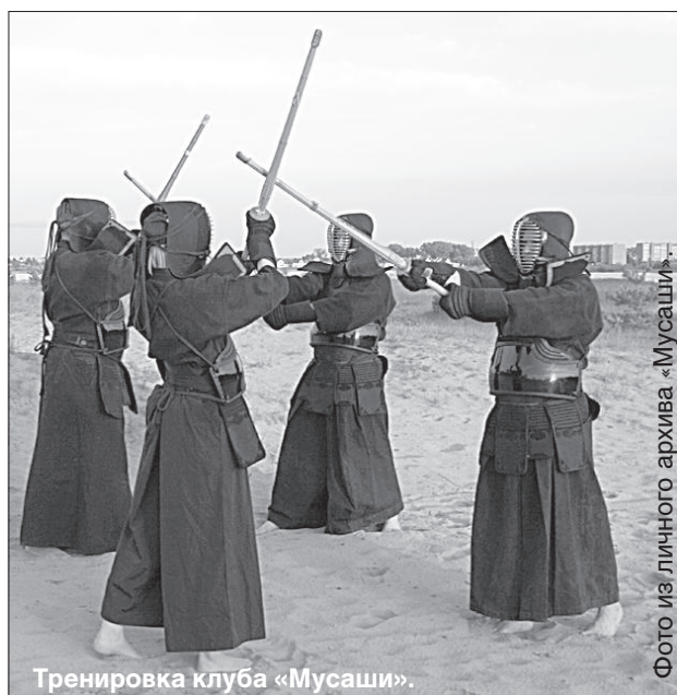
Тренировка клуба «Мусаши».