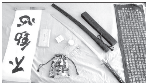
Предметы экспозиции, которые можно будет увидеть в день выставки.

огнестрельное оружие, тысячам приверженцев древних традиций не оставалось ничего иного, кроме как выйти на поле битвы и своими жизнями доказать императору, что не стоит отказываться от векового наследия. Не дрогнув, десятки тысяч самураев выступили против пушек и сложили в этой битве свои головы. Это заставило императора задуматься о том, что может и не стоит отбрасывать тысячелетнюю мудрость. После этого последовало разрешение практиковать искусство меча всем и даже людям без фамилии. Постепенно начали появляться более гибкие мечи и более прочные доспехи, и занятия в итоге при соблюдении техники безопасности перестали быть опасными.