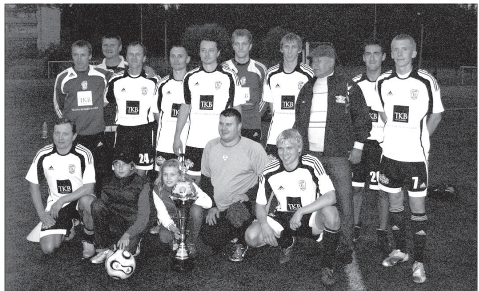
Двукратные чемпионы Даугавпилса по футболу с кубком.