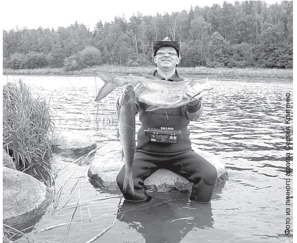
Пойманные этой осенью жерехи весят больше 5-ти килограммов каждый.

О присутствии этой рыбы свидетельствуют сильные удары хвостом по поверхности воды, что напоминает брошенную в воду горстку камешков. Именно эти удары часто вводят в заблуждение рыболовов, они стараются поймать рыбу в этих местах, но жерех не может находиться в одном мес-