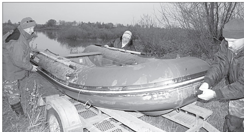
Рейд закончен и инспектора вытаскивают на берег лодку.

На грунтовой дороге видно, что свежие следы от автомобильных шин ведут в свентский лес, где на-