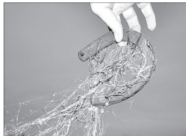
Сети погрузили в воду при помощи подков.

Штраф за нарушения правил рыбной ловли составляет от 20 до 500 латов. Нелицензированная рыбалка в промышленном масштабе карается денежным штрафом от 200 до 500 латов. Дополнительно налагается штраф за причиненный природе ущерб за каждую незаконно пойманную рыбу, например, за щуку – 20 латов. А если рыбу поймали браконьерской сетью, то штраф утраивается. На рыболова налагают штраф в 200 латов и в случае, если он идет вдоль озера или находится вблизи водоема, неся на плече или в сумке нелегальные