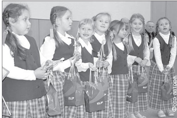
На мероприятии выступали воспитанники детсада №24.

жими инициативами «ВТА» выступала и раньше. Например, с 2003 года бесплатно застрахован Памятник свободы в Риге.