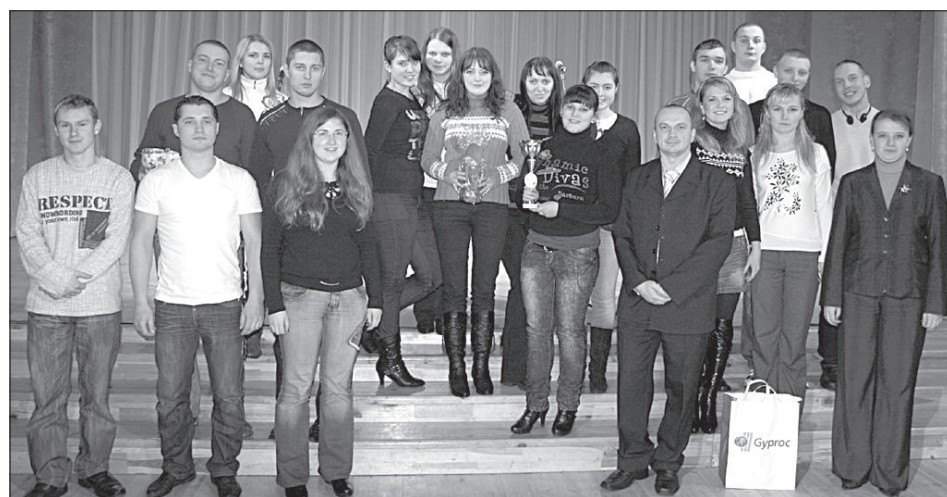
Самые эрудированные команды конкурса «Что? Где? Когда?».

На зимних каникулах победой амбельской команды завершился молодежный конкурс Даугавпилсского края «Что? Где? Когда?», посвященный кино, который устроил Науенский центр молодежных инициатив и спорта в сотрудничестве с методистами образования по интересам управления образования.