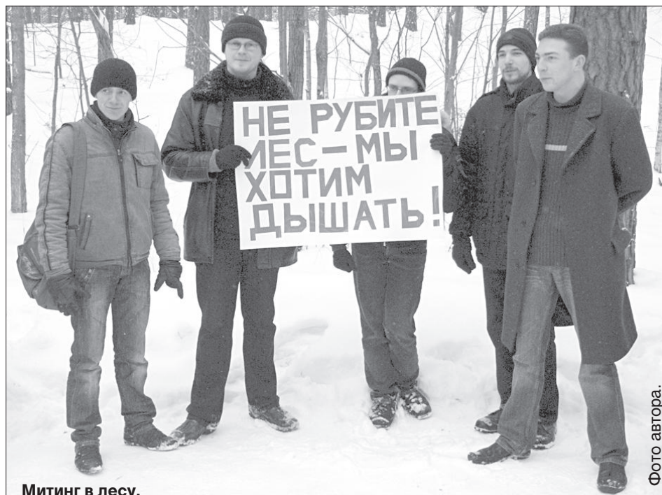
Митинг в лесу.