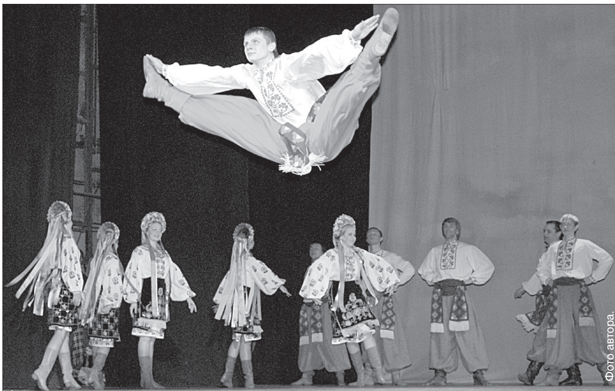
Некоторые номера были похожи на акробатические.