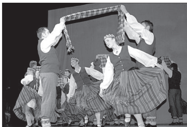
Танцует коллектив Дома культуры Даугавпилсского края «Ликсме».

гопака и танца кубанских казаков. Особенный темперамент артистов выражался в номерах, необыкновенно насыщенных сложными движениями и скоростью. Некоторые танцы были похожи скорее на акробатические номера, а самый старший участник коллектива поразил зал своей неумолимой энергией и обезоруживающей улыбкой. Как рассказала руково-