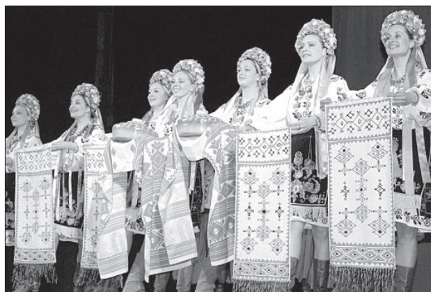
Хлеб-соль от украинских красавиц.

Благодарным даугавпилским зрителям талантливые танцоры продемонстрировали свой неистощимый творческий потенциал, исполнив народные танцы из разных районов Украины. Конечно, не обошлось без