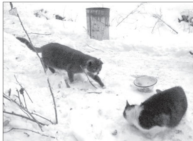
Кошки остались живы.

ялась, что он в Старых Стропах делает ремонт, как это было неделю тому назад».