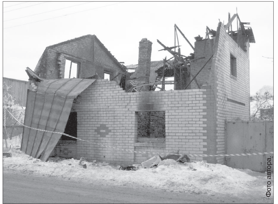
Все, что осталось от дома.