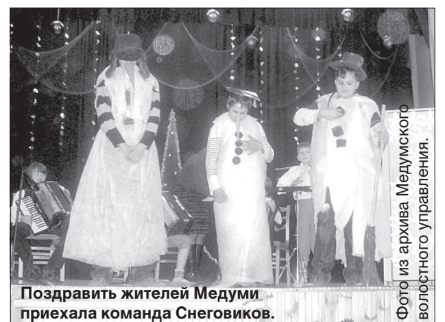
Поздравить жителей Медуми приехала команда Снеговиков.

Жители Медумской волости радовались замечательному подарку на Рождество, подготовленному волостным управлением, средней школой и Домом культуры. ■