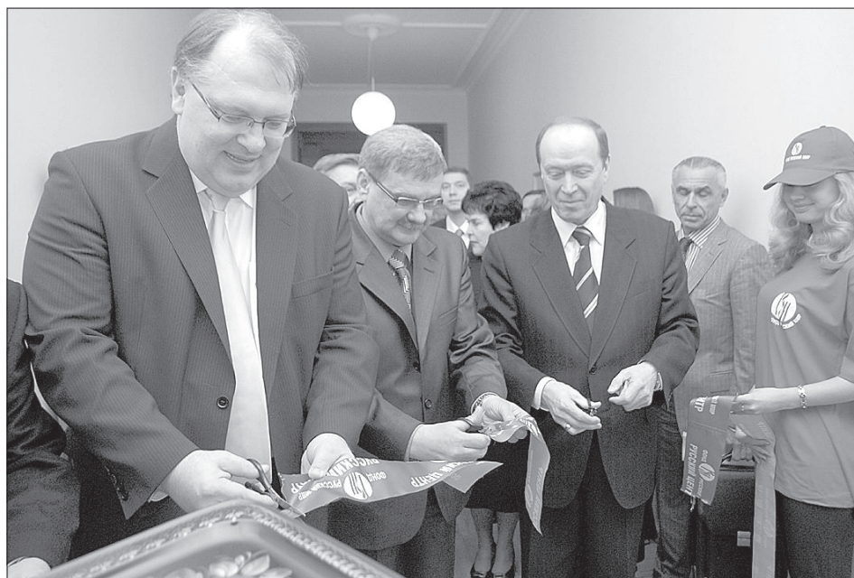
Торжественное открытие Русского центра.