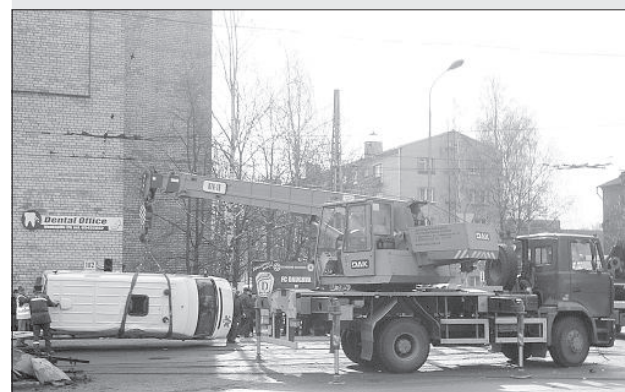
Автомашину «скорой помощи» эвакуируют после аварии.

29 марта около 11.00 в Даугавпилсе на перекрестке улиц 18 Ноября и Вентспилс столкнулись автомашина «Opel Omega» и машина «скорой помощи».