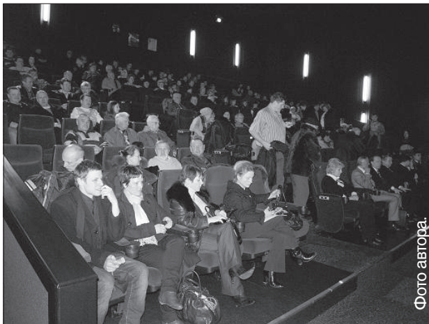
Премьера собрала практически полный зал.