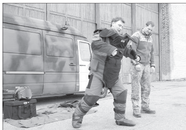
Автор статьи примеряет спецкостюм.