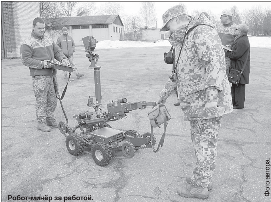
Робот-минёр за работой.