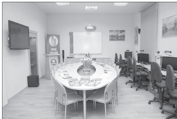
Современное оборудование Русского центра.

Год назад первый Русский центр в Латвии открылся в Риге, на базе Балтийской международной академии. Даугавпилс был выбран не случайно, так как большинство населения составляют русские, а в ДУ на протяжении многих лет успешно развиваются бакалаврская, магистер-