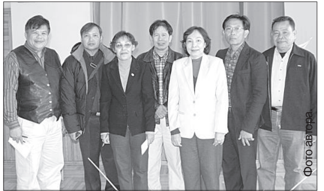
Делегация тайландских педагогов в Даугавпилсской государственной гимназии.