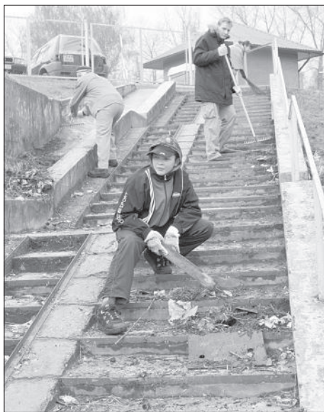
Ребята из Центра свободного времени «Мезглс» убирали часть береговой линии озера Губице.