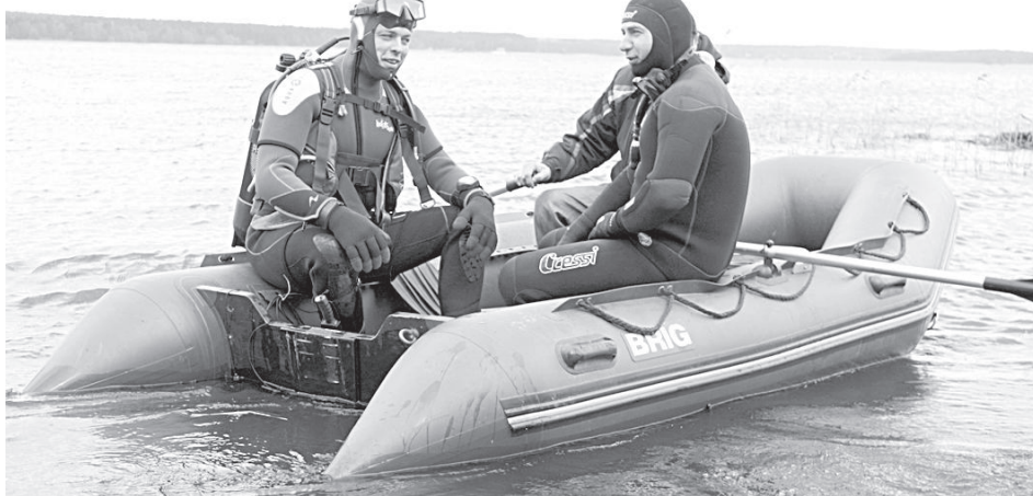
Дайверы уверены, что на дне Стропского озера много мусора.