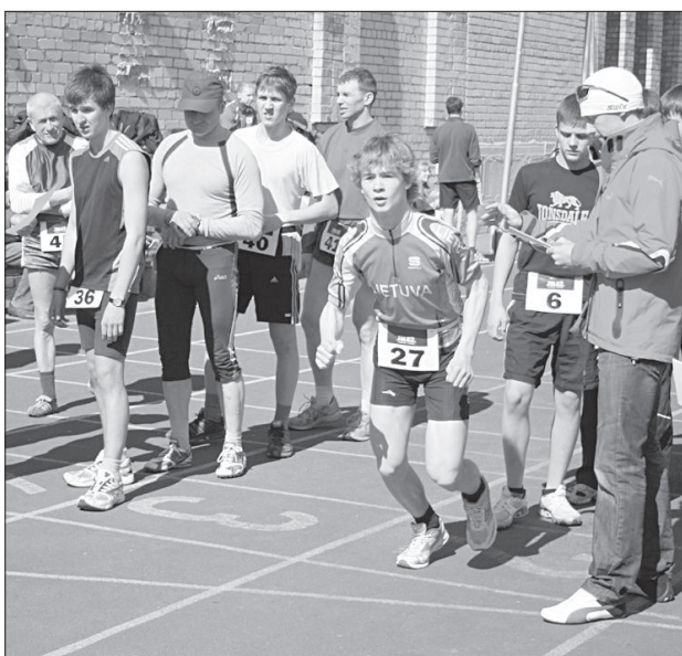
Вторая часть соревнований — бег.