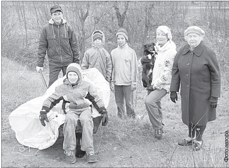
Одна из ругельских бригад не испугалась проливного дождя.