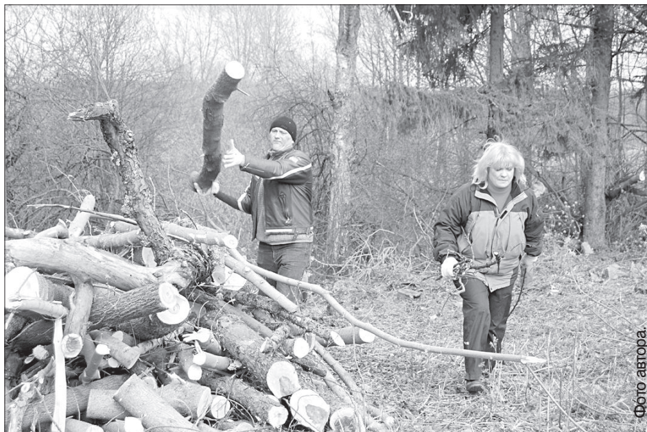
Жители Амбелей сжигают лишние ветки и деревья.