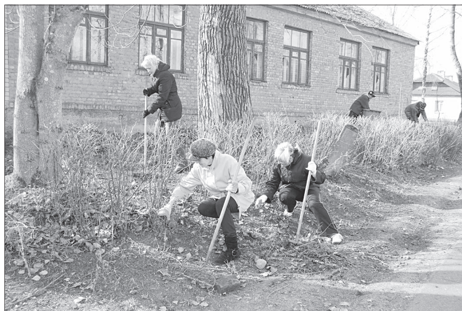
Жители Науене привели в порядок старое здание школы.