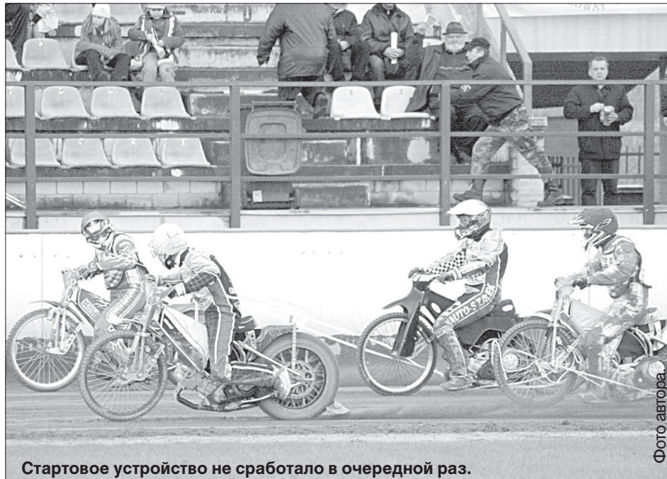
Стартовое устройство не сработало в очередной раз.