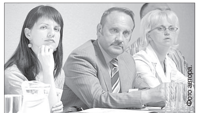
Гости из Талсинского края.

Гости посетили Вишкский центр социального обслуживания, Центр услуг «Пиладзис» и пансионат в Калупской волости, а также ООО «Науенский сервис услуг», Центр культуры Даугавпилсского края, Сельский центр, Свентскую среднюю школу и дом Я. Райниса в Беркенеле. ■