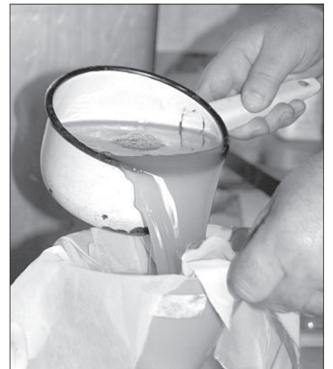
Живое свежее пиво бродит даже в кружке.

массой, кастрюлю снимают с огня и кладут в нее творожно-сырную массу. Потом массу, завязанную в марлю, ставят под гнет.