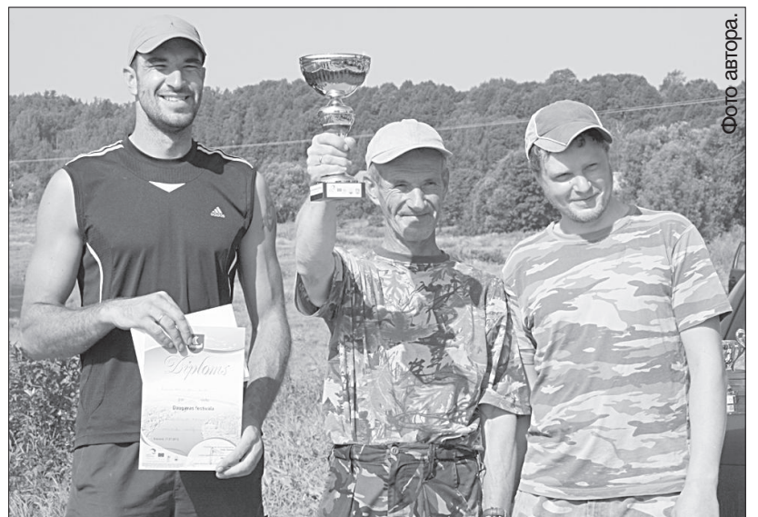
Команда «Ливану акис» завоевала первое место.

а теперь заботится о защите водных ресурсов. Накануне вечером он вместе с инспектором по рыбнадзору обследовал озеро Лея в Аулейской волости. Министр признаёт, что необходимо активнее бороться с браконьерами, это актуально для всей страны. Г. Упениекс рассказал рыбакам, что сейчас разрабатываются правила хозяйствования в природ-