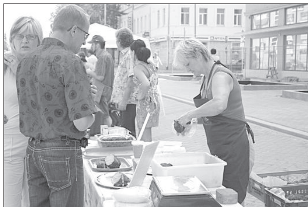
Перед покупкой мяса надо снять пробу.