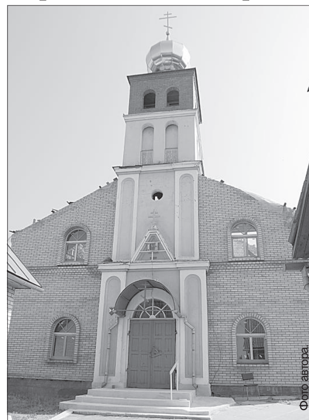
Главное сейчас – построить крышу храма.

Жизнь, к сожалению, внесла свои коррективы в хорошо налаженный темп. Цены на строительные ма-