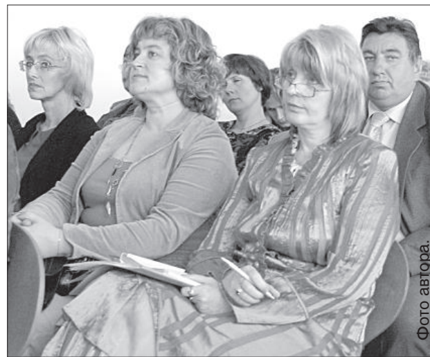
Педагоги внимательно слушают.

К педагогам обратился депутат Сейма Виталий Айзбалтс, который подчеркнул, что на селе школа выполняет культурную и социальную функции. Проводя школьную реформу, са-