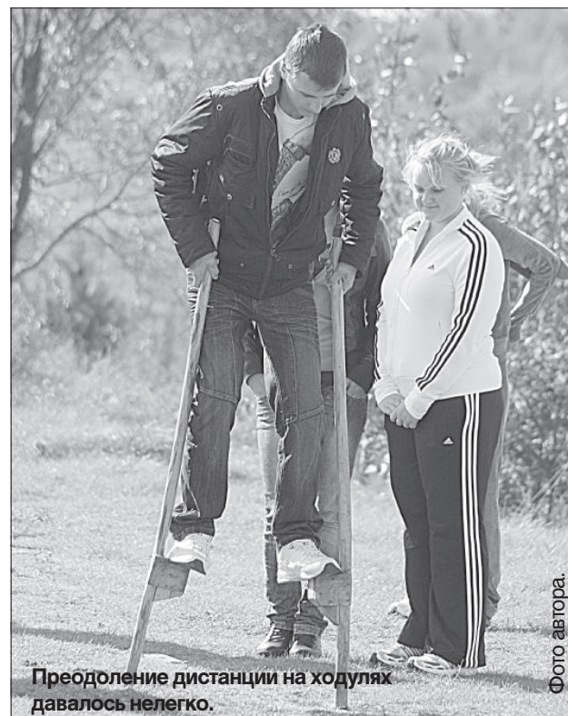
Преодоление дистанции на ходулях давалось нелегко.