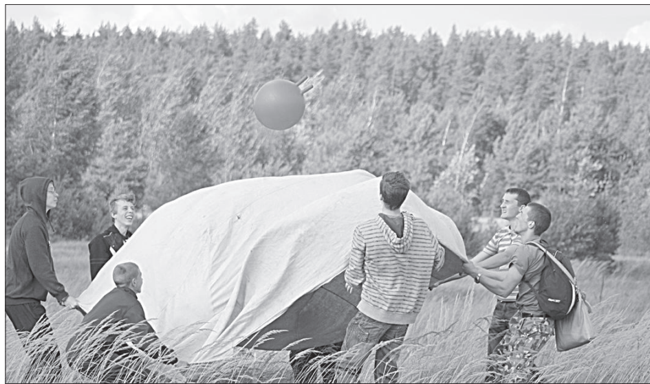
Мяч надо не только подкинуть, но и поймать.

После весёлых соревнований состоялось награждение. Проигравших не было, каждая команда получила свой приз. В заключение у большого костра в позитивной атмосфере прошло посвящение учеников десятых классов в старшеклассники. ■