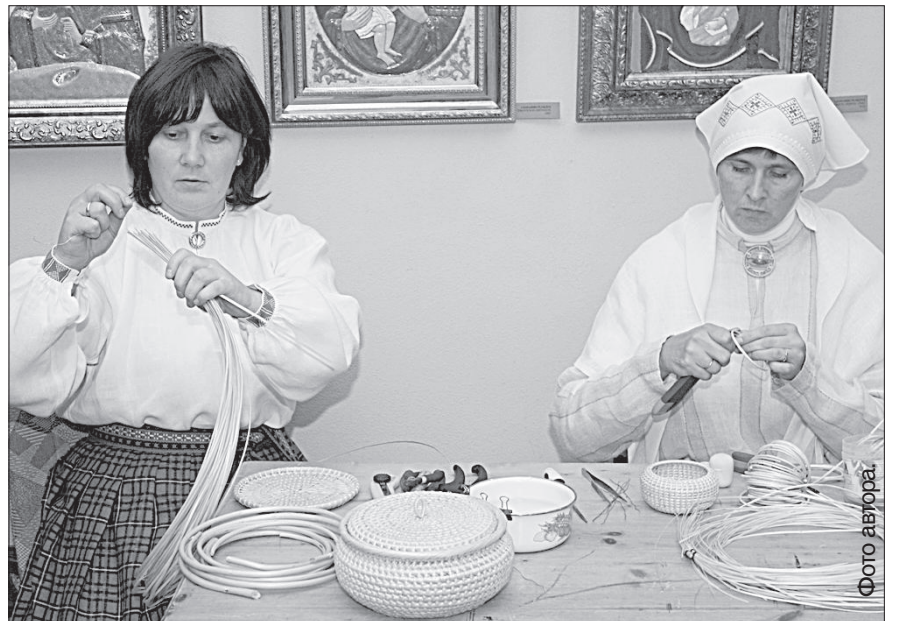
Участницы пленэра демонстрировали гостям свои техники плетения.