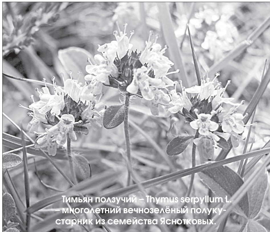
Тимьян ползучий – Thymus serpyllum L. – многолетний вечнозелёный полукустарник из семейства Яснотковых.

Горьковато-пряный запах тимьяна ни с чем не спутаешь. Он освежает, бодрит и наполняет новыми силами уставшие тело и душу.