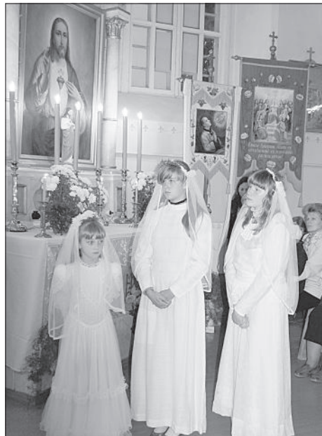
Украшение праздника – дети и молодёжь Элернского прихода.

Епископ также напомнил об ожидаемых выборах в Сейм, призвав выбрать местных кандидатов в депута-