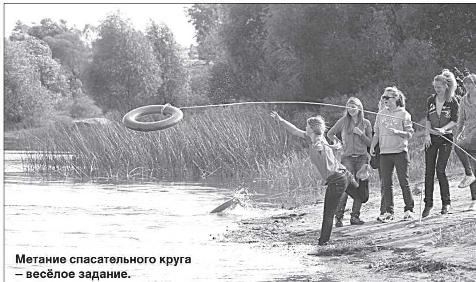
Метание спасательного круга — весёлое задание.