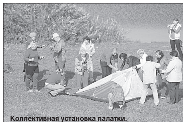
Коллективная установка палатки.