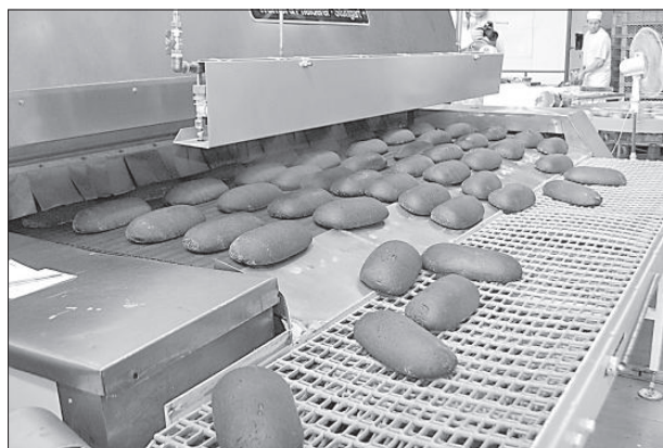
Готовая продукция разойдется по магазинам Латвии.

21 сентября на предприятии по выпечке хлебобулочных изделий АО «Maiznīca Dinella» запустили новую производственную линию по выпечке ржаного хлеба.