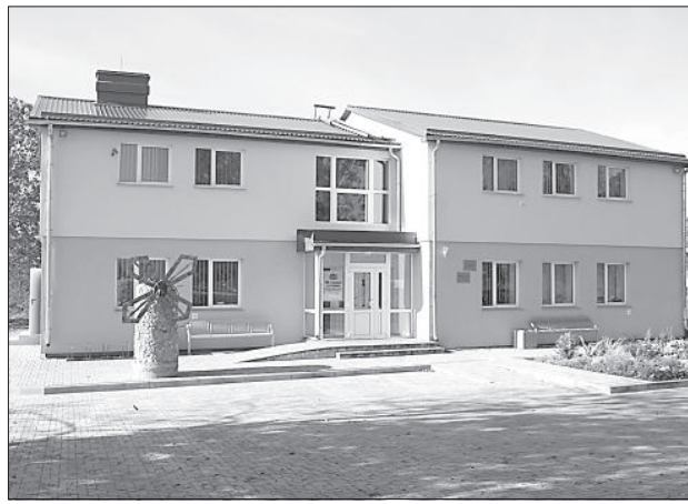
Общественный центр «Лауцесе».

В 1945 году, после войны у людей появилась потребность в книгах, тогда в поселке Калкуны Лауцесской волости Илукстского уезда и появилась первая изба-читальня. Библиотека несколько раз переезжала, находясь то в помещениях бывшей конторы совхоза «Красное знамя», то в Силиниеках. Уже тогда ее фонд насчитывал более 1000 книг.