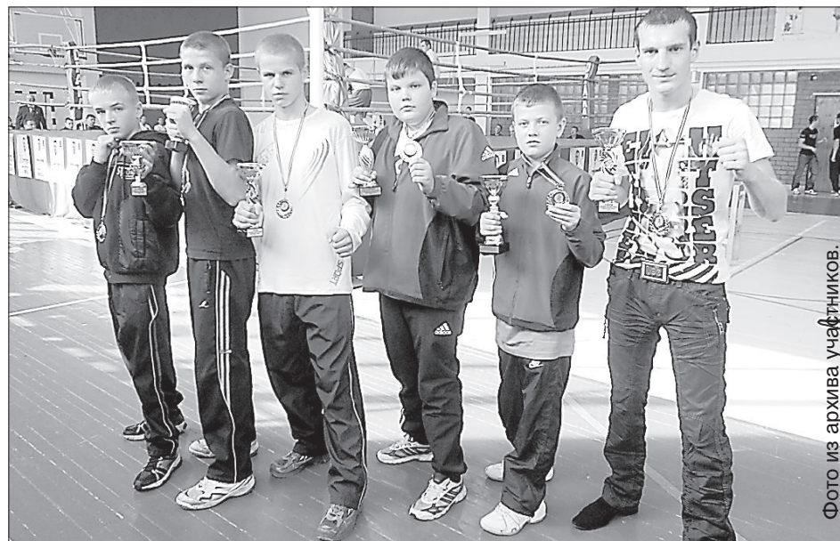
Призёры и победители кубка Олайне 2010.