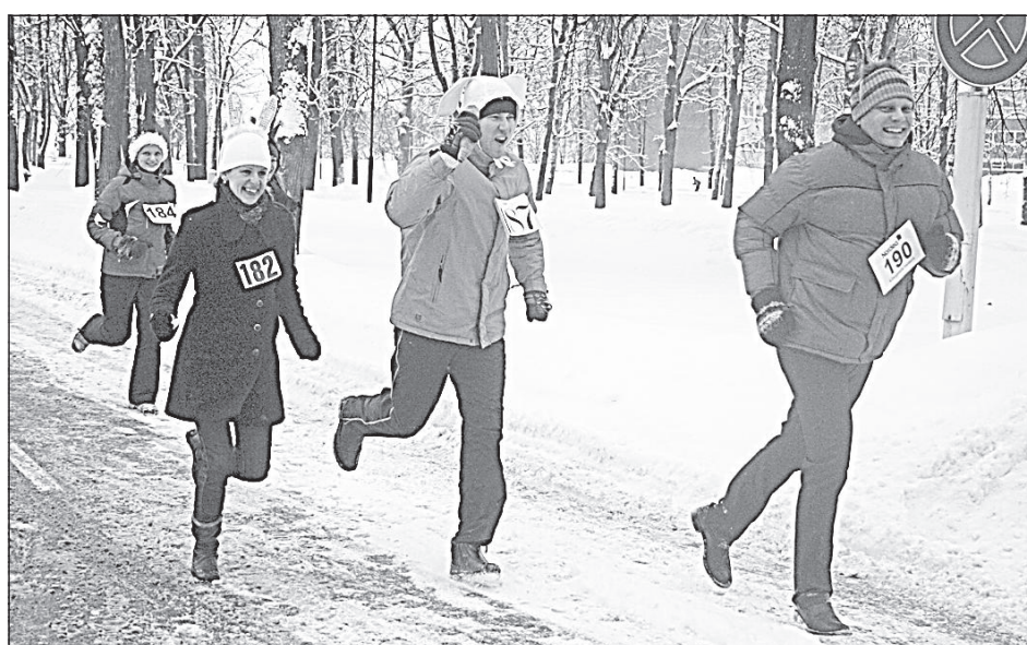
Была замечена группа кроликов, вооружённых морковкой.

ЧИТАЙТЕ "ЛАТГАЛЕС ЛАЙКС" В ИНТЕРНЕТЕ WWW.LATGALESLAIKS.LV