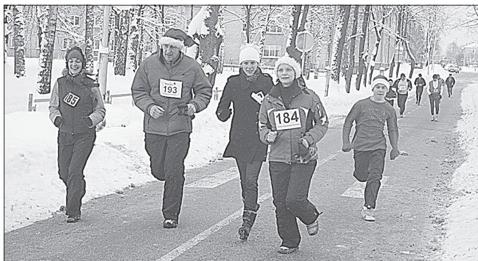
Последние метры до финиша.