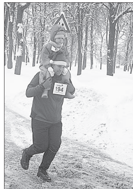
Самый удобный способ передвижения при беге – на плечах у папы.