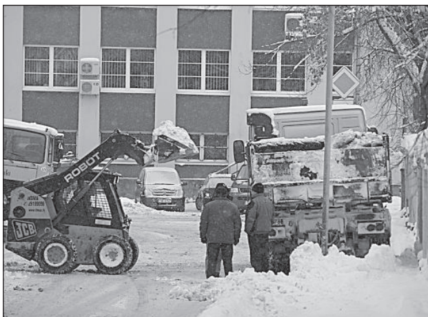
Уборка снега на улице Лачплеша идет полным ходом.

Для многих работников коммунальных служб Даугавпилса Новый год начался не с праздников и выходных, а с борьбы с непрекращающимся снегопадом. На данный момент стихия немного успокоилась, и в ближайшее время циклонов не ожидается, поэтому есть время перевести дух.