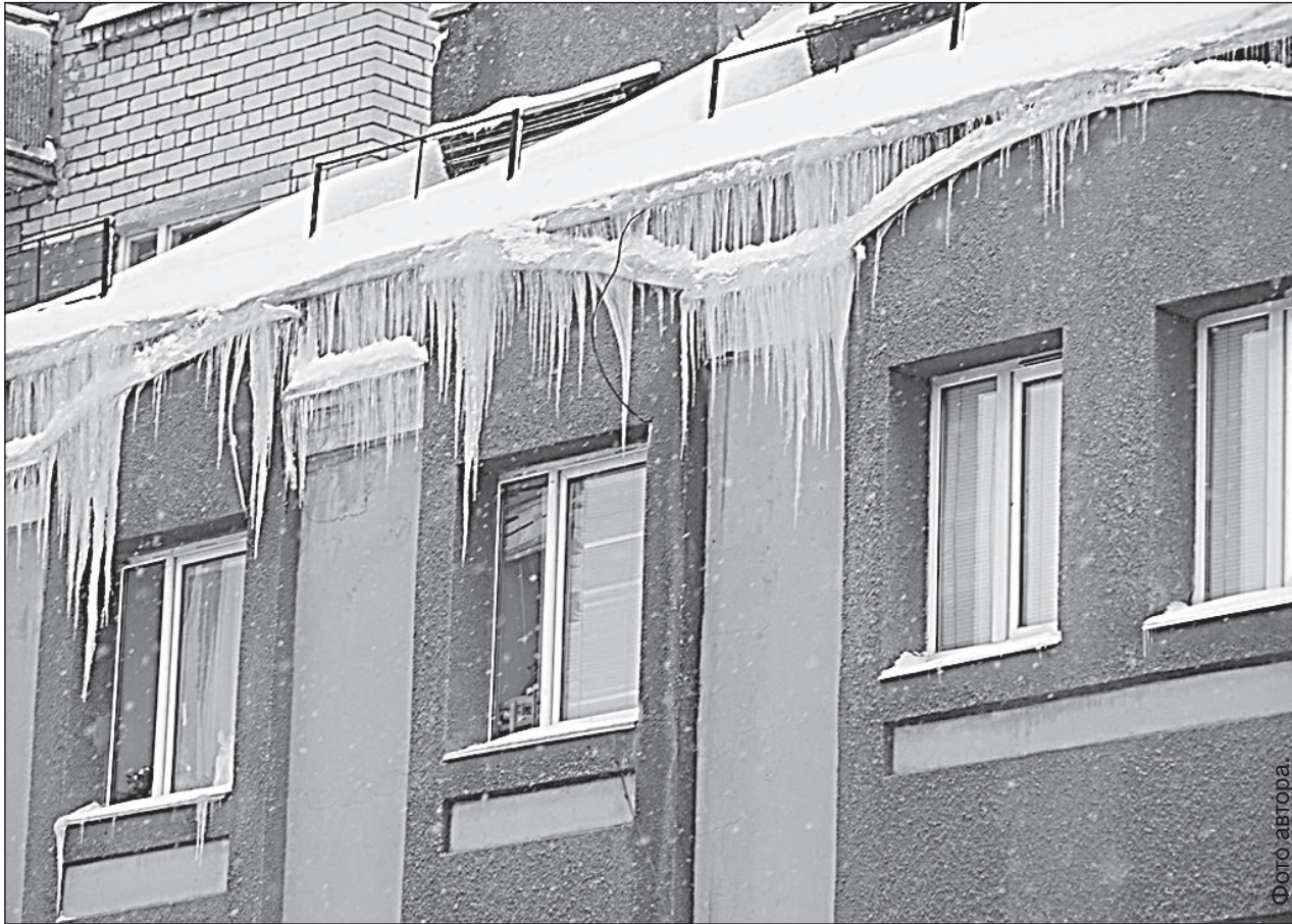
Сосульки на улице Алеяс растут не по дням, а по часам.