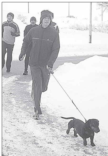
По следу бегунов отправилась боевая такса.

Однако не только за спортивными результатами гнались участники пробега. Для многих важен был сам факт участия. Традиционно спортивной формой пробега становится красный колпак гнома. Многие надели кроличьи уши, так как символ 2011 года – Белый кролик. А Дед Мороз, как всегда наблюдал за пробегом на финише, экономя силы для новогодней ночи. ■