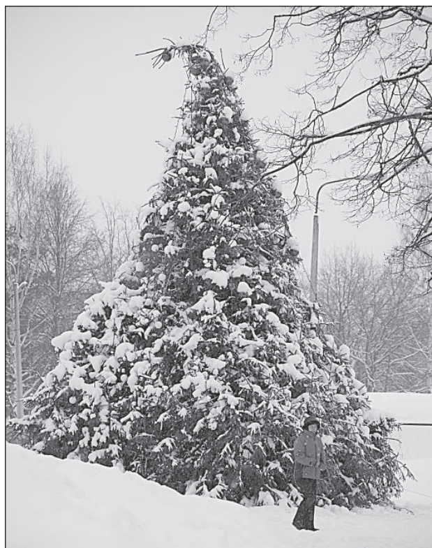
Новогодняя елка у ледового дворца устала бороться со снегопадами.

Из-за сугробов на многих улицах движение автомобилей затруднено, поэтому уже с 2 января начался вывоз снега. На данный момент частично сугробы убраны с улиц Саулес, Парадес, Циетокшня и Лачплеша. Что касается остановок общественного транспорта, то отпихивать сугробы уже некуда. В ближайшее время там тоже начнется вывоз снега. Планируется составить список, где будут указаны улицы, с которых снежные