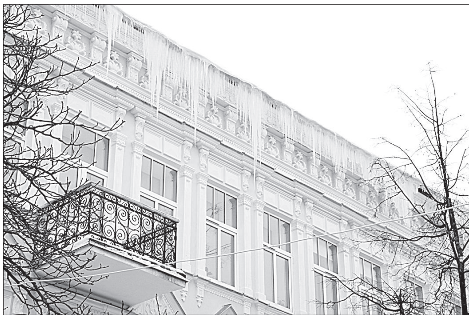
На некоторых зданиях такие «сталактиты» стали элементом декора.