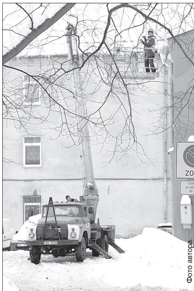
Коммунальные службы города в борьбе с сосульками.

Нынешней зимой работники полиции самоуправления за неочищенные