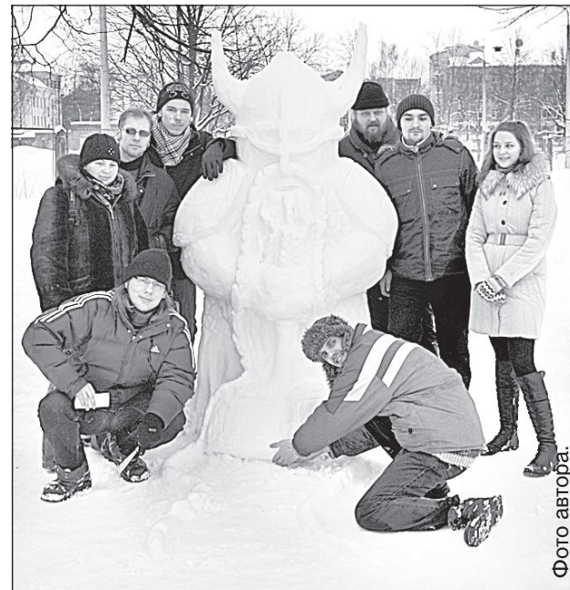
Команда КИМ «Рубеж» с «Викингом».