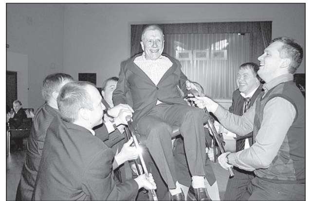
Чествование легендарного легкоатлета Вольдемара Пинки.