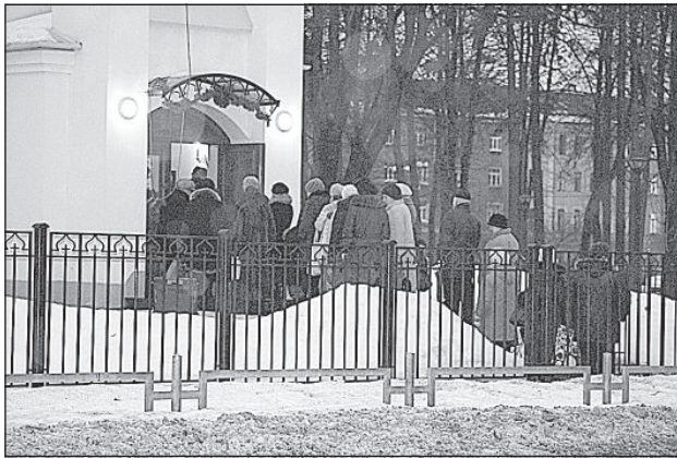
Очередь за крещенской водой 19 января.

— Напишите, пожалуйста, о целебных свойствах крещенской воды! — просит читательница из Деменской волости.