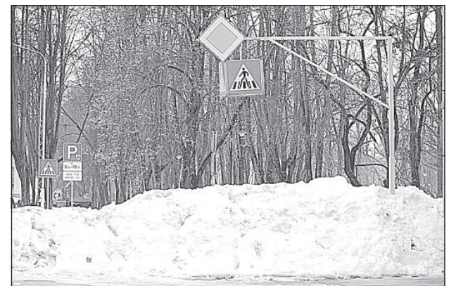
Пешеходный переход на перекрестке улиц Ригас и Музея в Даугавпилсе.