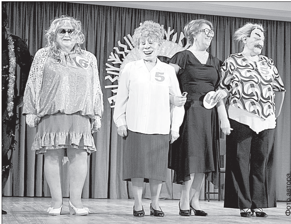
Участники то и дело меняли маски.