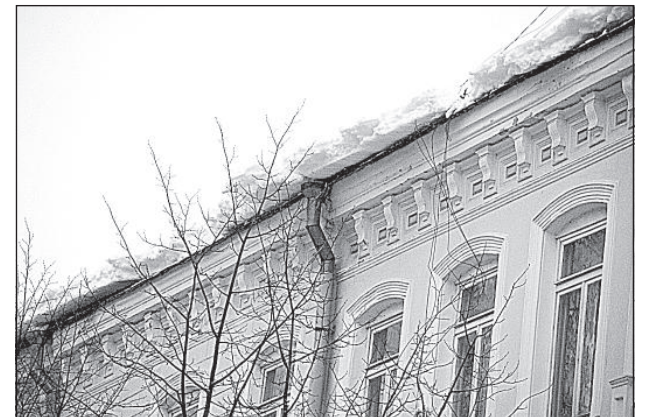
Здание возле музея на ул. Ригас в Даугавпилсе.