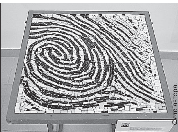
Выставка — это итог Международного кавказского проекта при поддержке ЮНЕСКО. Студенты и пре-