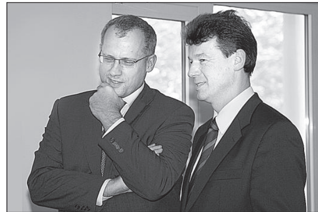
Министр здравоохранения Юрис Барздиньш и депутат Сейма Рихард Эйгим.