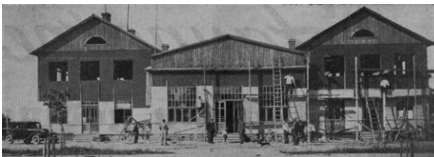
Jaunlatgales aizsargu pulka namam jauna seja.

Savāko informāciju publicēsim ne vien paši sev, bet arī visas Latvijas zināšanai Latvijas sabiedrisko mediju tīmekļa vietnē lsm.lv. Latvijas Miera līguma stāsts ir mūsu, Baltinavas ieguvumu un zaudējumu stāsts. Sarakstīsim to visi kopā un 11. augusta godam visi kopā nosvinēsim šī līguma simtgadi!