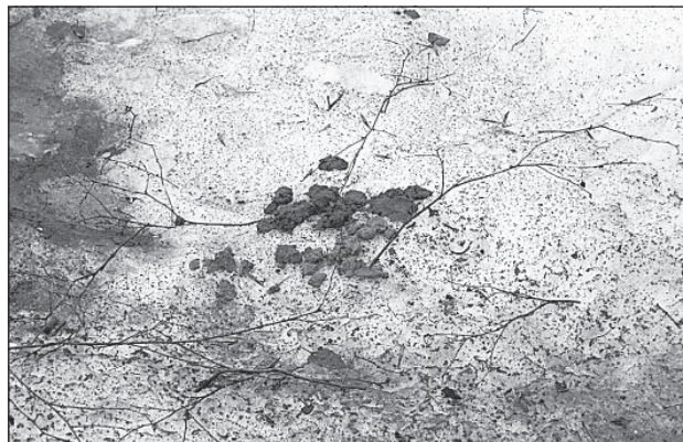
«Мины» в центральном парке.

такой форме, что охота стыдить нерадивых собачников у женщины отпала. За несколько лет работы она лишь несколько раз видела, как хозяин собаки убирал за ней. Еще один дворник сказал, что давно привык убирать за животными, для него гораздо хуже убирать самих животных, сбитых автомобилями.