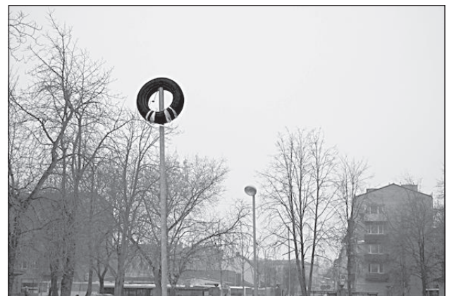
Разнообразие фонарей в центральном парке в Даугавпилсе.