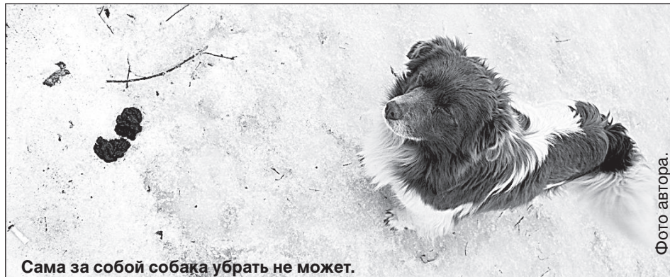
Сама за собой собака убрать не может.

Выходим на прогулку в центральный парк, парк Дубровина и на прилегающие улицы. С утра там достаточно чисто, дворники работают добросовестно и успевают убрать территорию после утреннего моциона собачников. Однако собаки ходят не только по тротуарам, и поэтому их какашки в основном «цветут» на снегу и прошлогодней траве. Дворник из центрального парка рассказывает: «Мы уже смирились с тем, что зимой и летом ежедневно приходится убирать дерьмо. На это мне убирают все знакомые дворники. Но я не вижу выхода, потому что у нас очень невоспитанные люди и не уважают других». Однажды дворник сделала замечание мужчине, овчарка которого пристроилась опорожнить кишечник возле ледового дворца. Но он ответил ей в