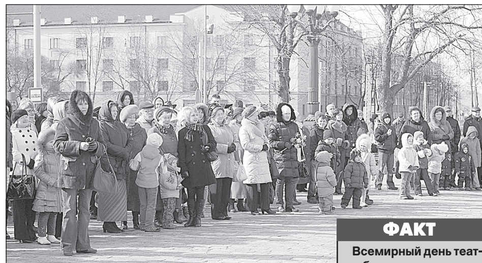
Зрители с удовольствием аплодировали артистам.

зрителей номера легендарного джазмена Луи Армстронга и экстравагантной Людмилы Гурченко. Их роли исполнили молодые актеры, которые пополнили ряды коллектива театра и уже успели понравиться зрителям во многих постановках.