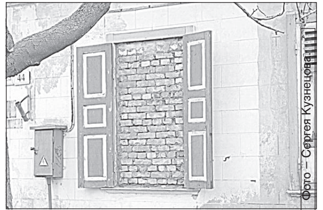
«Окно в Европу».