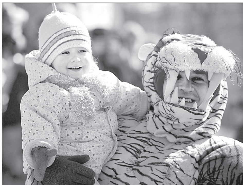
Тигр совсем не страшный.

Несмотря на ветреную погоду, зрителей было много. Они охотно аплодировали артистам, а кто-то