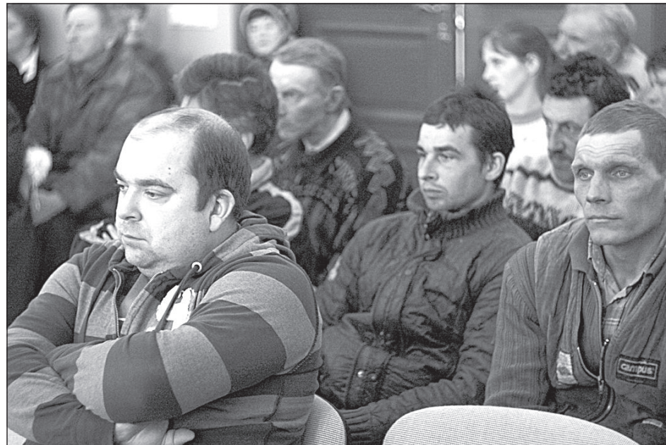
Жители Вецсалиенской волости внимательно слушали отчеты.

Родители попросили полицейских дежурить на