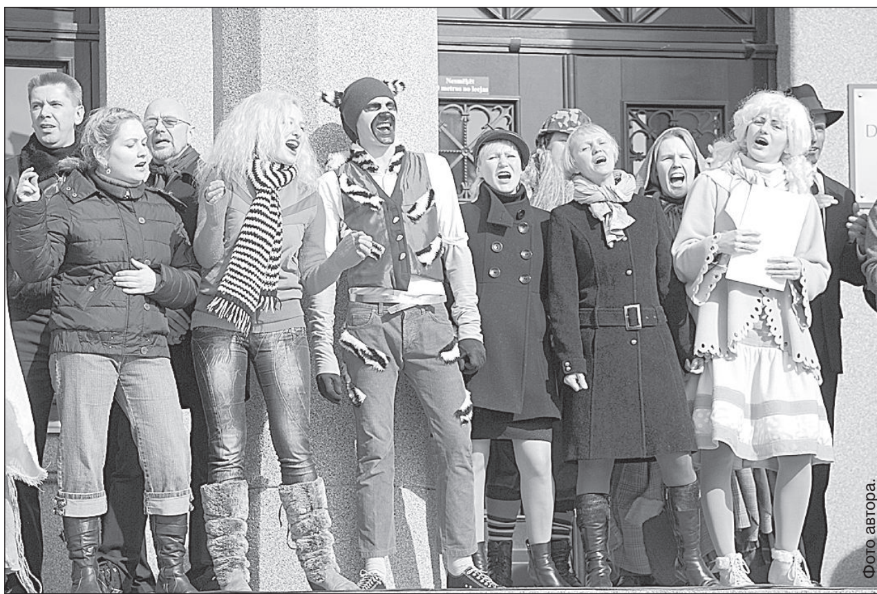
Актеры Даугавпилсского театра исполняют свой гимн.