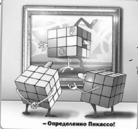
- Определенно Пикассо!