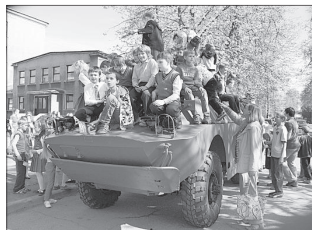
Внимание детей привлекала участвовавшая в мероприятиях военная техника.