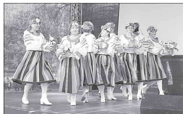
«Белорусская полька» на сцене праздничного концерта.