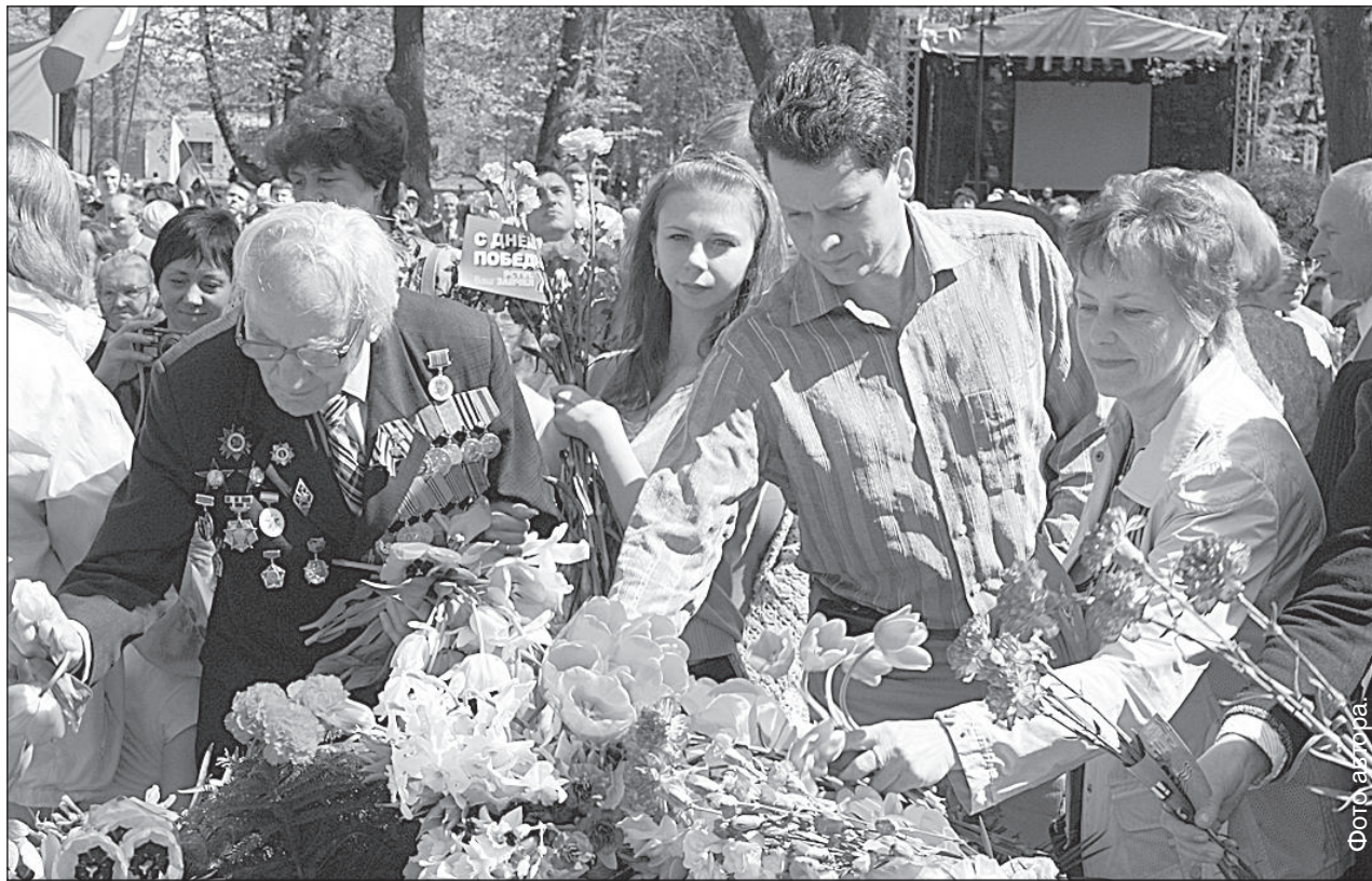
В память о событиях тех лет возложили цветы в парке Дубровина.