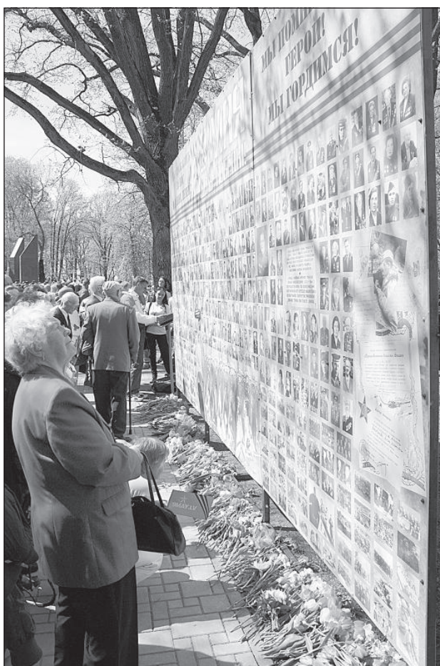
Стена памяти собрала сотни фотографий и жизненных историй.