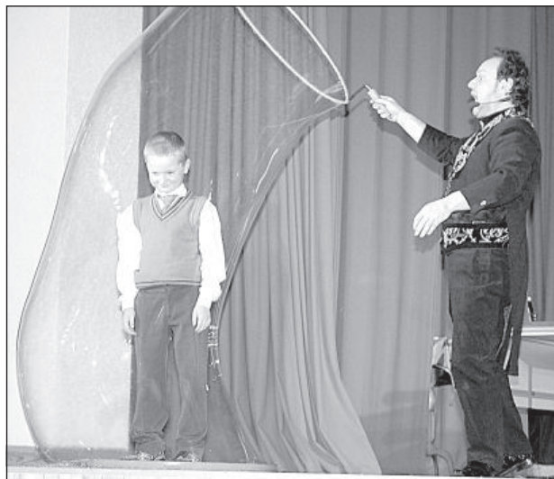
Иллюзионисты выдувают мыльные пузыри.