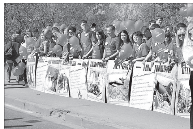
Активисты приветствовали ветеранов праздничными плакатами.