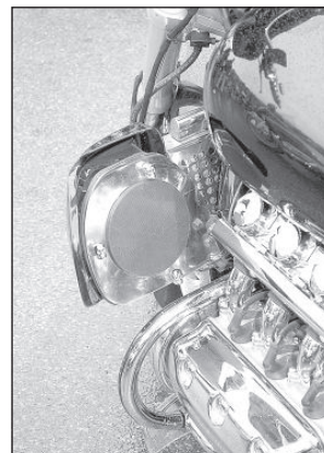
Один из байкеров установил на своем мотоцикле колонки, чтобы слушать в дороге музыку.