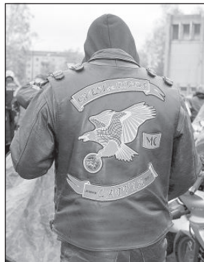
Визитная карточка байкера — кожаная куртка с символикой и названием мото клуба.