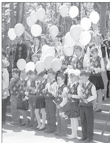
По окончании митинга воздушные шары взмыли в небо!

После митинга на площадь Виенибас приземлились парашютисты. Несмотря на порывистый ветер, они под бурные овации зрителей успешно сели в заданный квадрат. Потом в парке Дубровина начался праздничный концерт самодеятель-