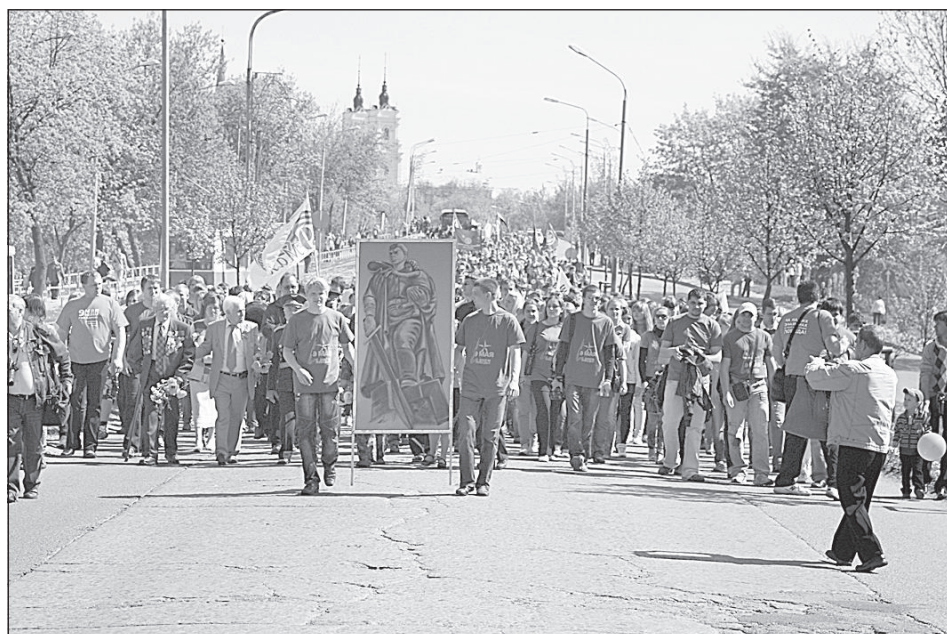
Огромное количество жителей прошло по улицам города к Вечному огню.