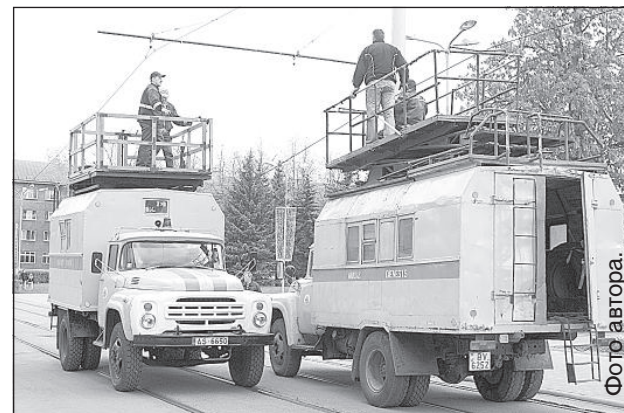
Чтобы восстановить движение, аварийные бригады работали в сумасшедшем темпе.

Около 9.00 грузовой автомобиль фирмы «СКД-D», выгрузив в сквере А. Пумпура груз, стал выезжать, и неопущенной стрелой зацепил контактную сеть. Обрыв проводов полностью остановил движение трамваев по маршруту № 1 и № 3. При падении линия электропередачи повредила фасад здания и сломала вывеску спортивного магазина.