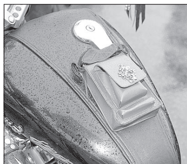
Мотоциклу подходит кожаная сумочка для мобильного телефона и различных мелочей.