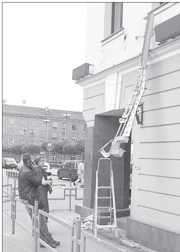
Вывеска спортивного магазина разбита вдребезги.