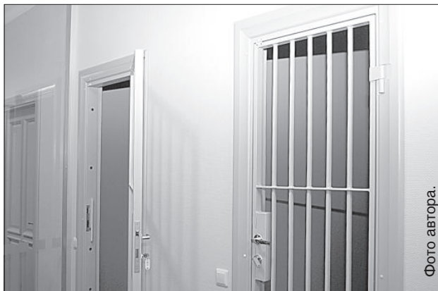
Камеры предварительного заключения.