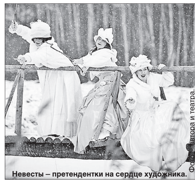
Невесты – претендентки на сердце художника.