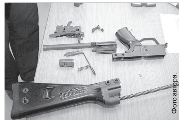
Автомат АК-4 Дзинтарс Патмалниек разбирает и собирает за 1,5 минуты.

патриотически настроенное молодое поколение.