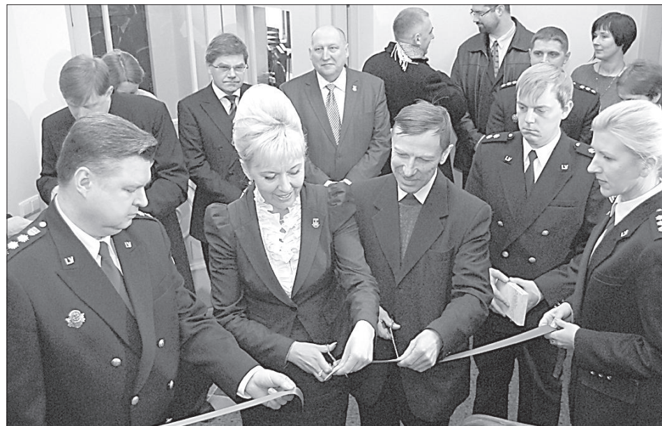
Торжественное перерезание ленточки.