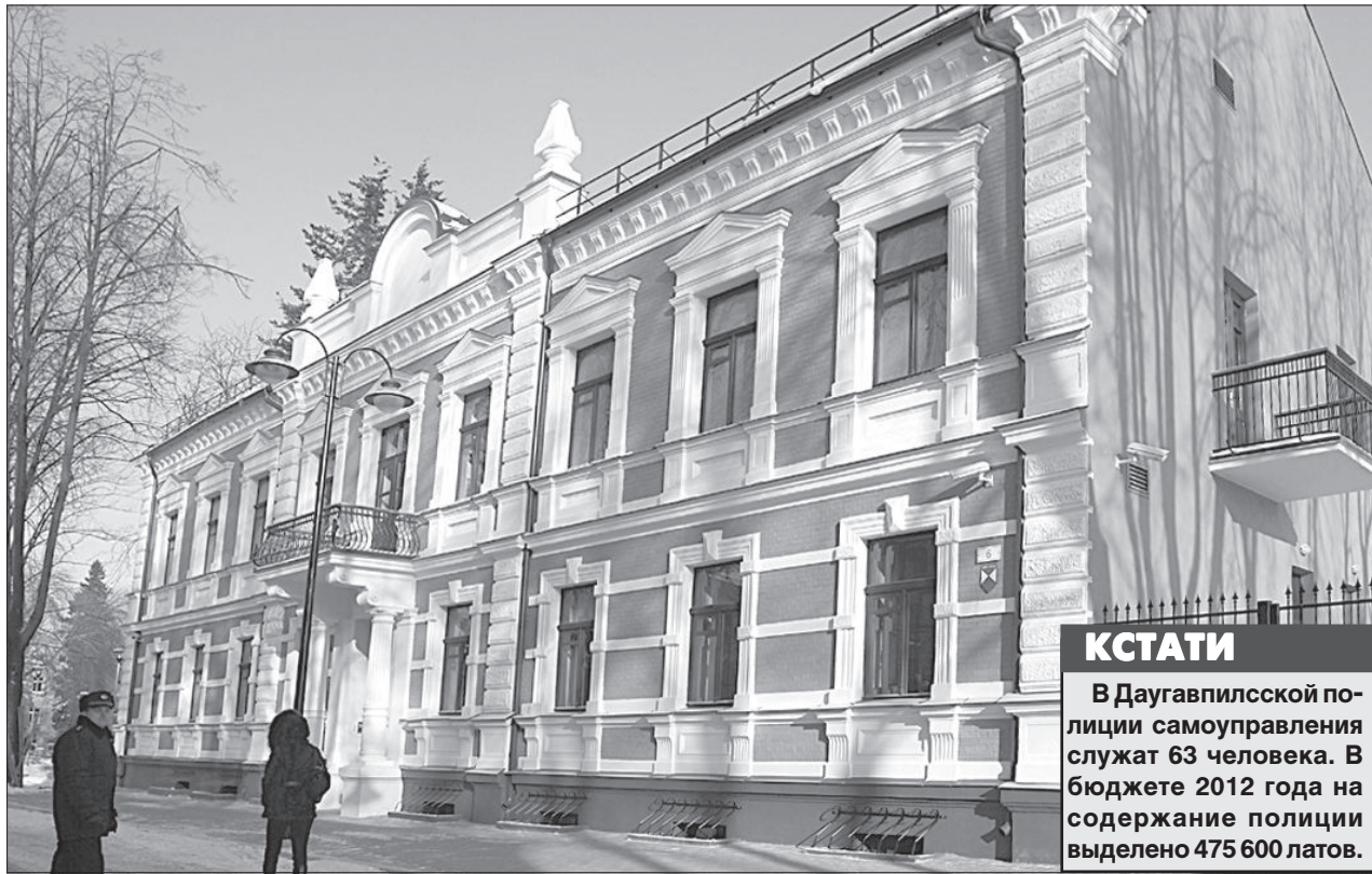
Здание, украшающее исторический центр Даугавпилса.

Елена Иванцова 3 февраля в торжественной обстановке было открыто обновленное здание полиции самоуправления на ул. Музея, 6.