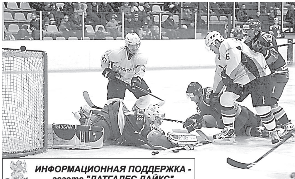
ИНФОРМАЦИОННАЯ ПОДДЕРЖКА - газета "ЛАТГАЛЕС ЛАЙКС"

Начала второго периода ознаменовалось взятием ворот со стороны «Латгале» — Дмитрий Фуников (Виталий Лещёв) — 2:1. Концов-