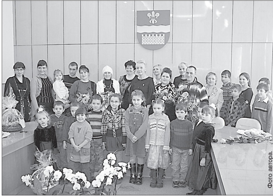
Общее фото на память.

9 марта в думе четыре многодетные матери получали поздравления от руководства города и управления социальных дел.