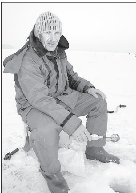
Осташенок на рыбалке отдыхает.

С чемпионатом Даугавпилского края радости зимней рыбалки еще не заканчиваются. Уже 17 марта до 7.00 все ценители этого вида досуга приглашаются в Вишкское волостное управление, чтобы подать заявку на участие в открытом индивидуальном чемпионате волости. ■