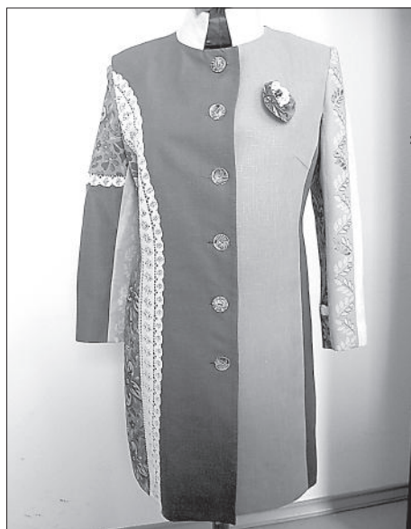
В платье соединены разнообразные ткани и различные техники рукоделия.