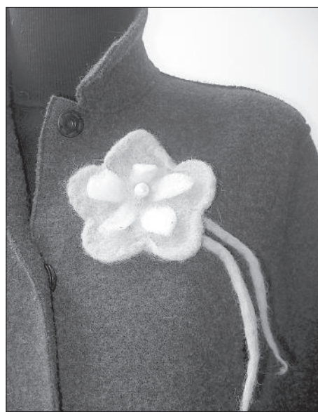
Одежде подходят аксессуары из валяной шерсти, в том числе цветы.