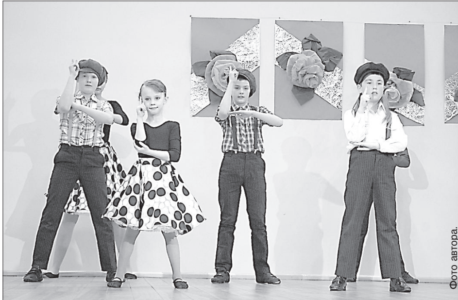
Выступает новый коллектив современного танца.

Г. Мелнис напомнил, что в 2011 году за деньги фондов ЕС при долевом участии думы был реконструирован Дом культуры, где в новых помещениях в этом году начнет работу библиотека, предстоит еще отремонтировать крышу. К сожалению, нет денег, чтобы