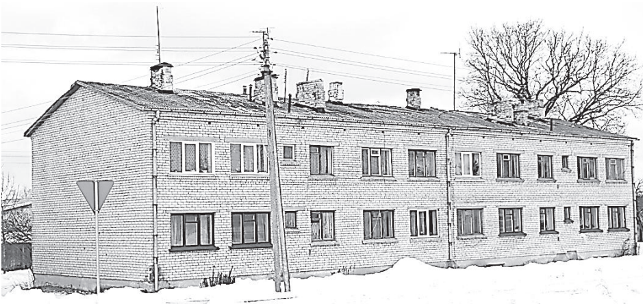
12-квартирный дом в Каплавe.